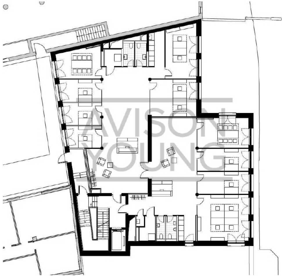
Beispiel 1 OG 380 m 2