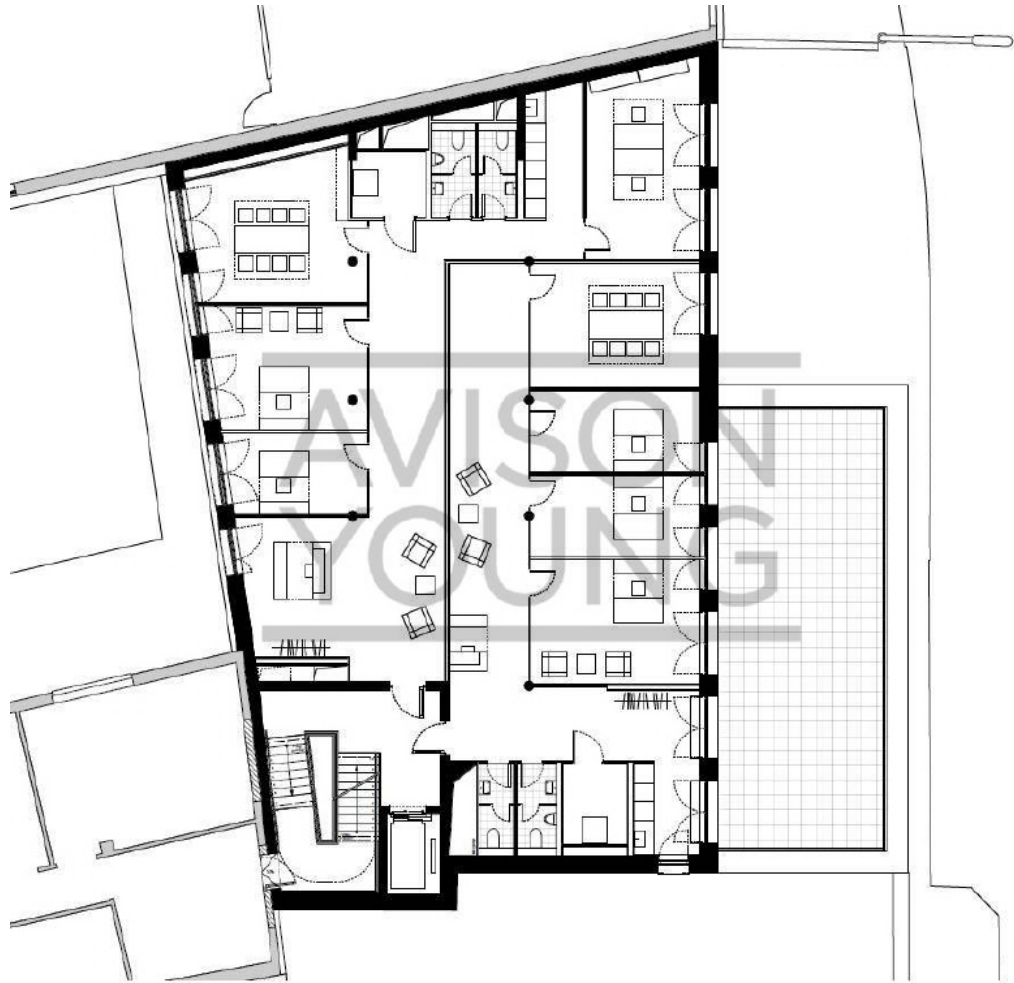
Beispiel 2 OG 350 m 2