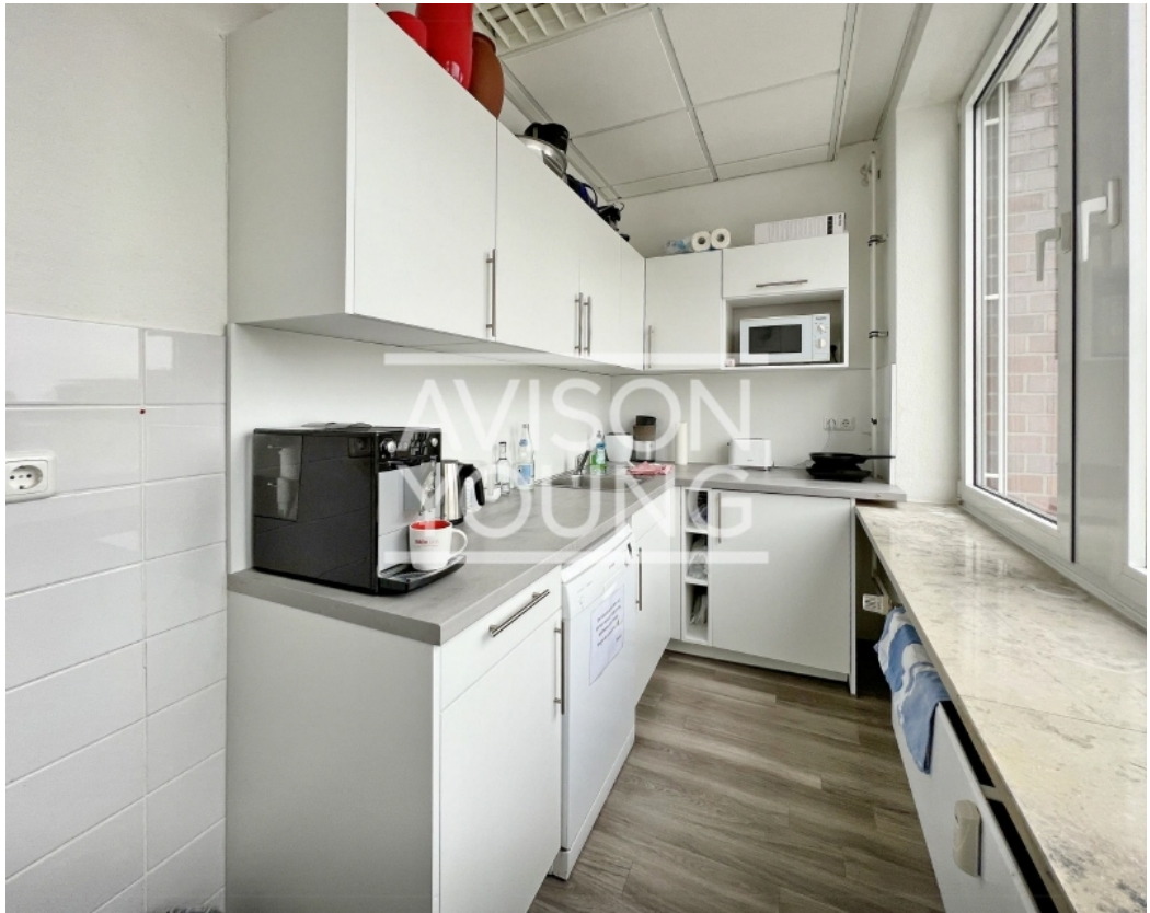
Haus B, 2 OG Innenansicht