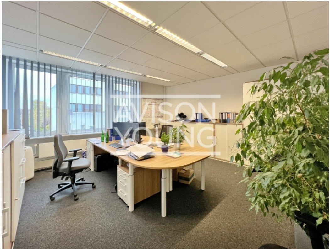
Haus B, 2 OG Innenansicht