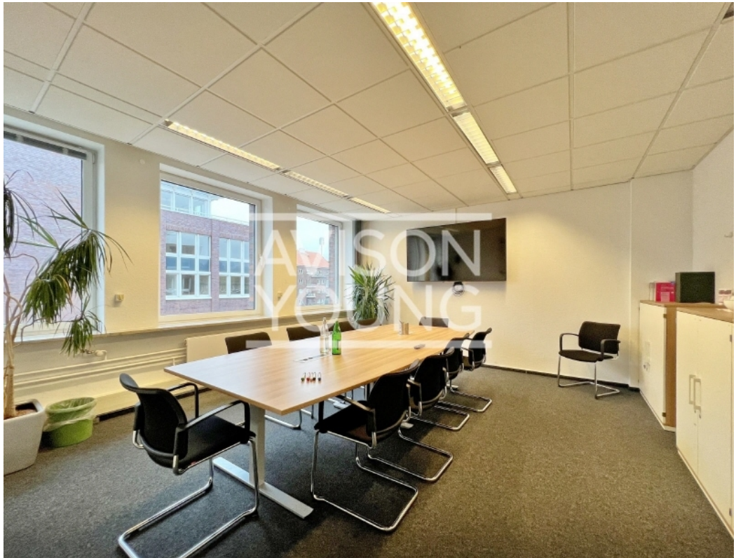
Haus B, 2 OG Innenansicht