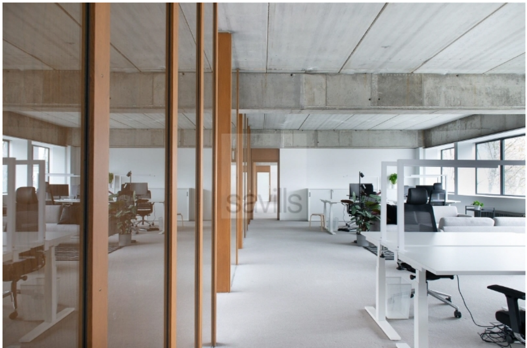
Medienpool Waterloohein, Waterloohein 5-9, Innenansicht