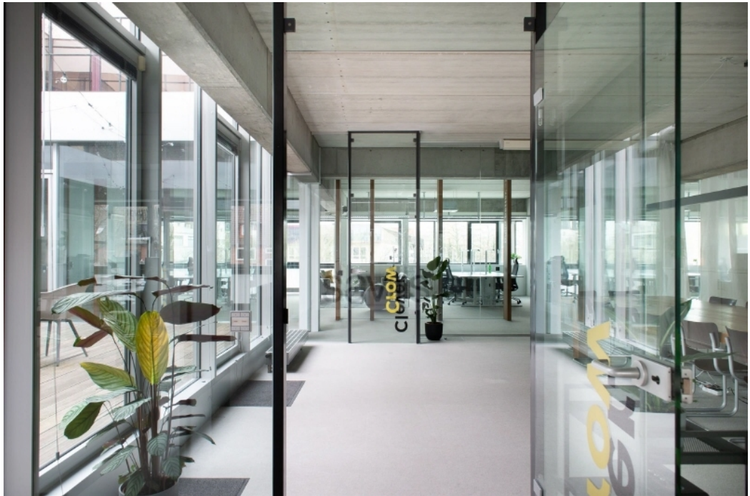
Medienpool Waterloohein, Waterloohein 5-9, Innenansicht