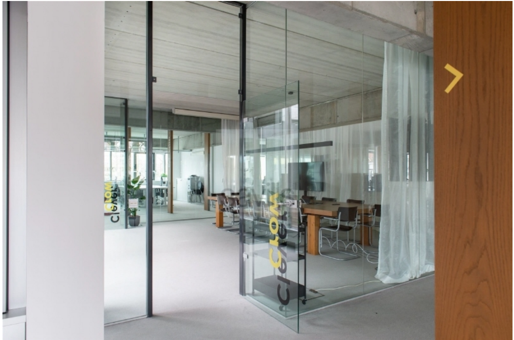
Medienpool Waterloohein, Waterloohein 5-9, Innenansicht