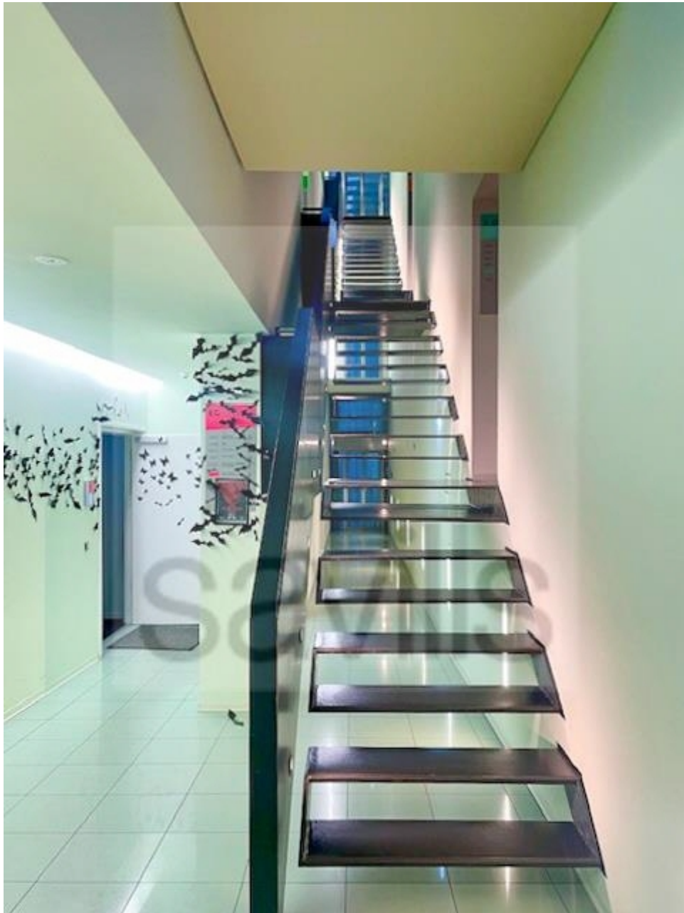
Treppenhaus - Waterlooain 5