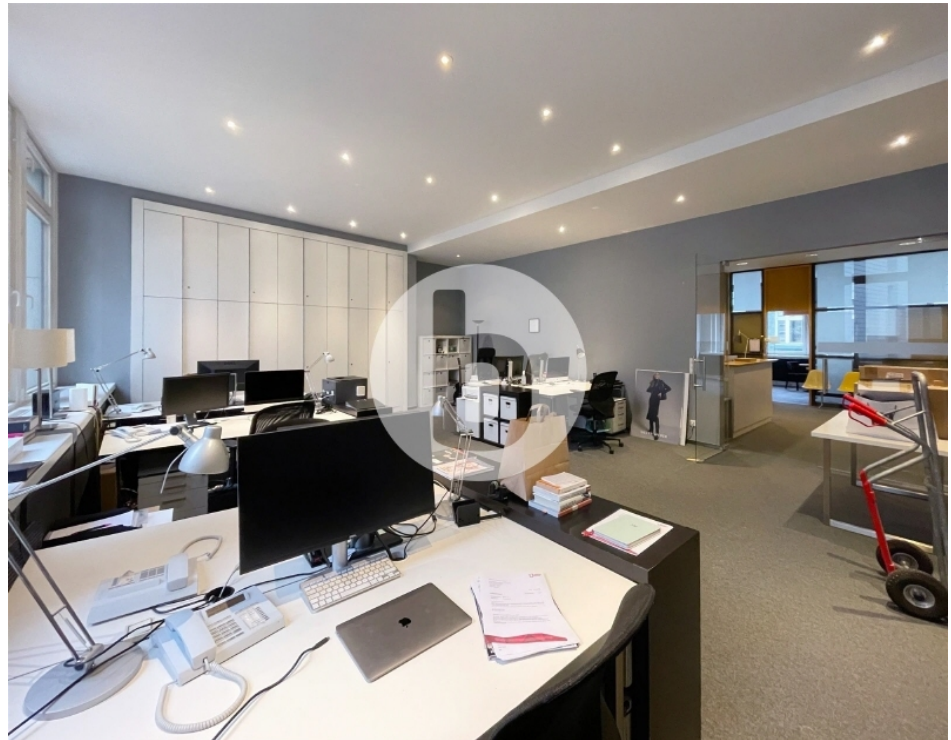
Innenansicht - 2 Obergeschoss mit ca 381 m 2