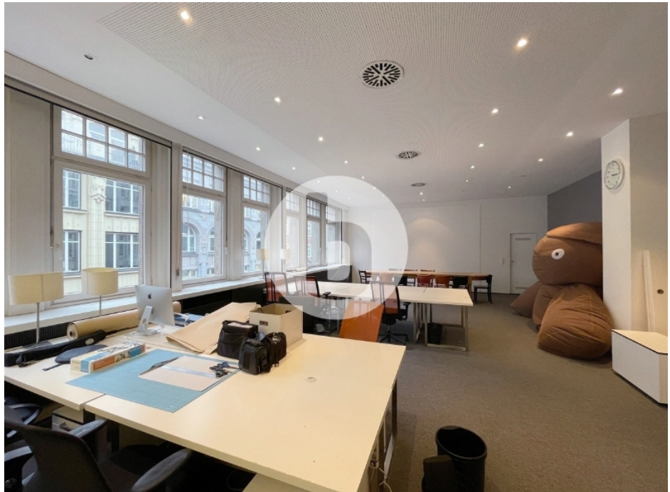
Innenansicht - 2. Obergeschoss mit ca. 381 m 2