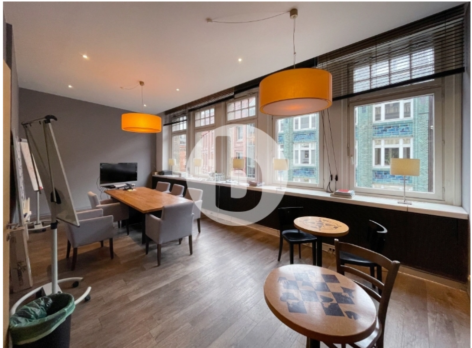
Innenansicht - 2. Obergeschoss mit ca. 381 m 2