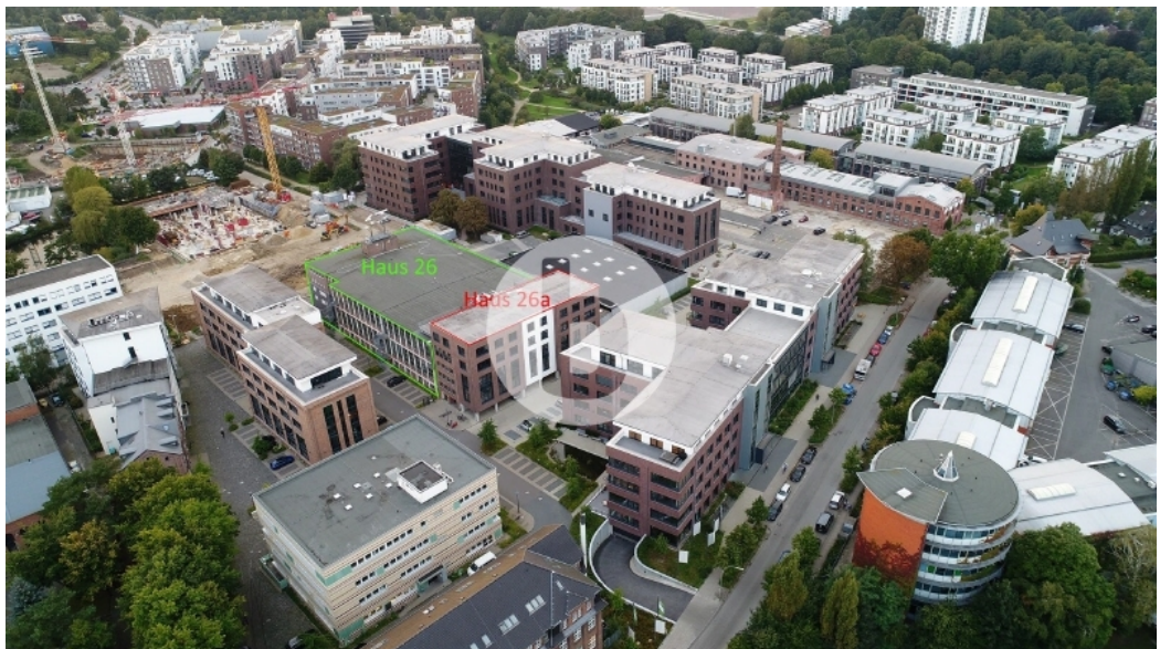
Übersicht - Drohnenbild