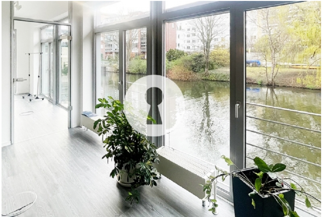
Blick auf Wasser