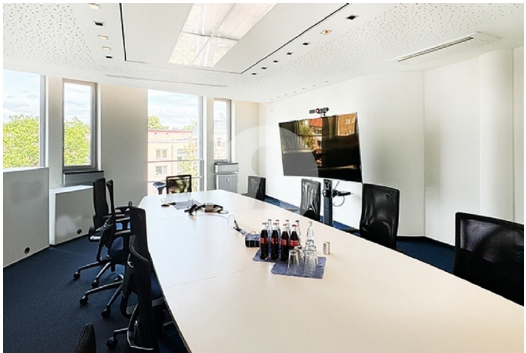
Besprechungsraum Ansicht 1