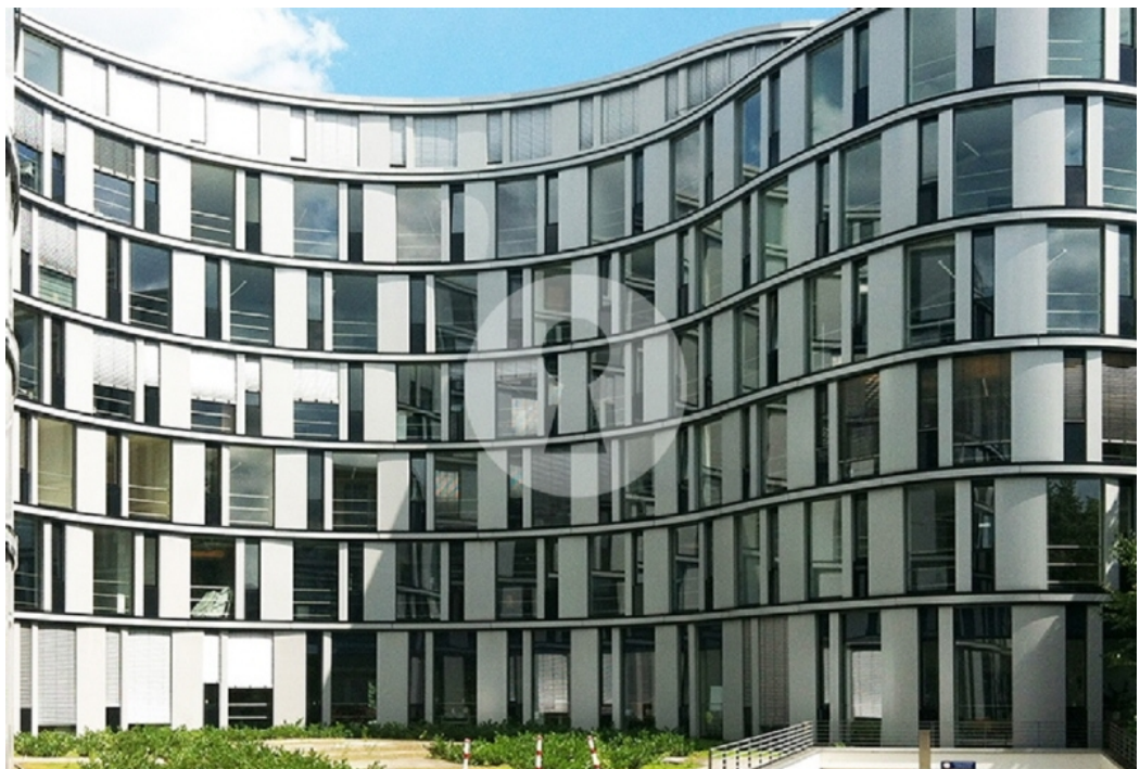
Ansicht Zugang zur Tiefgarage