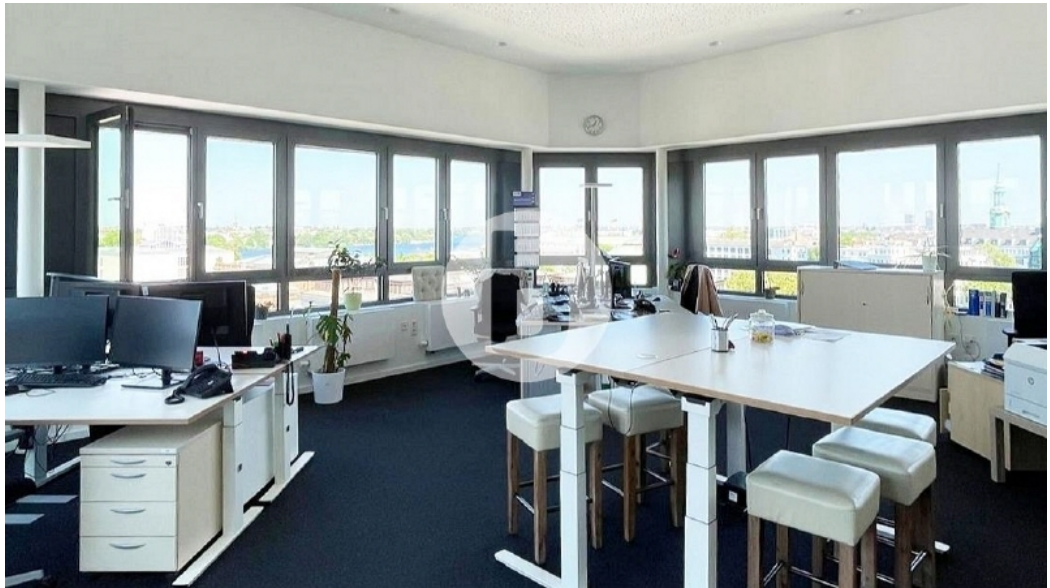
Innenansicht 8 OG