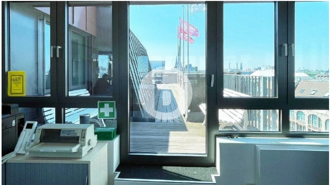
Innenansicht 8 OG