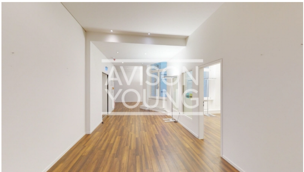
2 Obergeschoss, Innenansicht