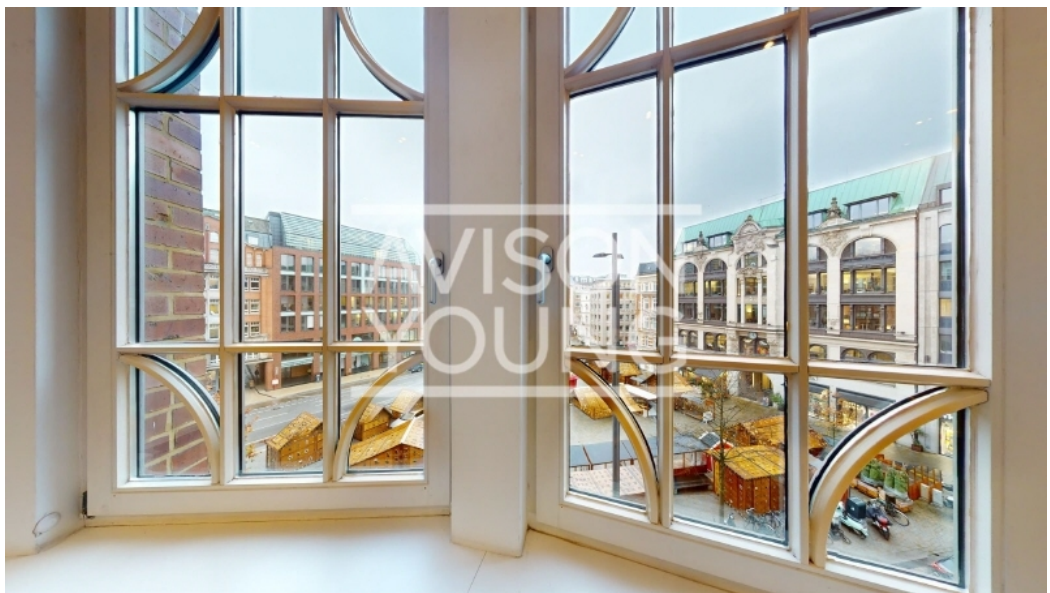
2 Obergeschoss, Ausblick