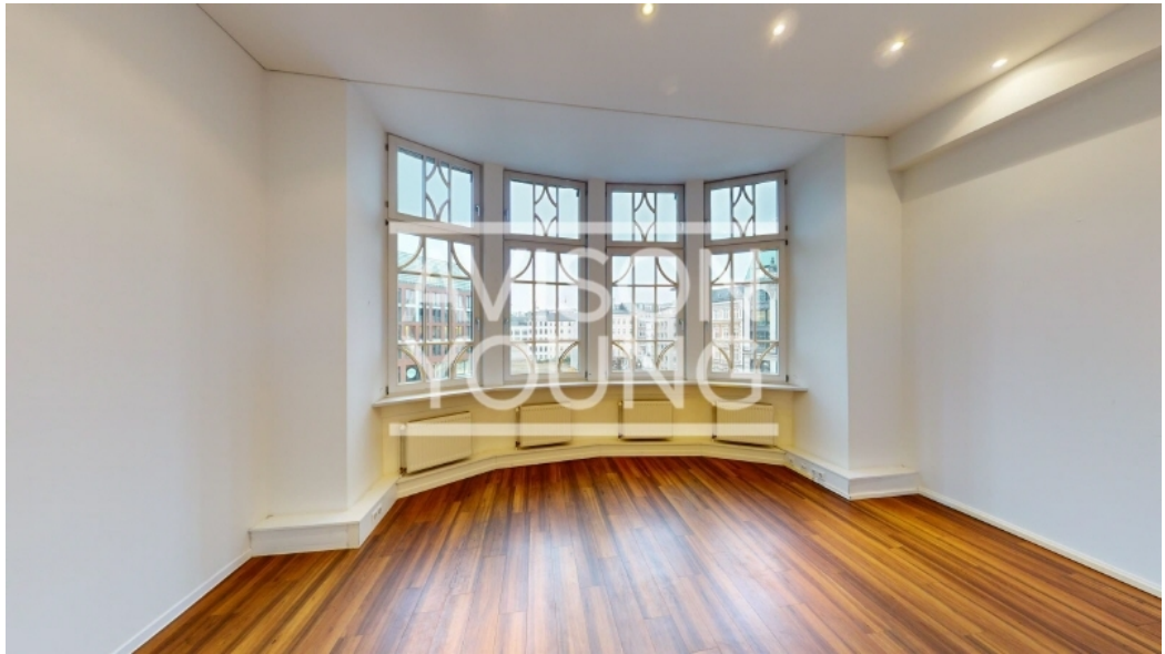
2 Obergeschoss, Innenansicht