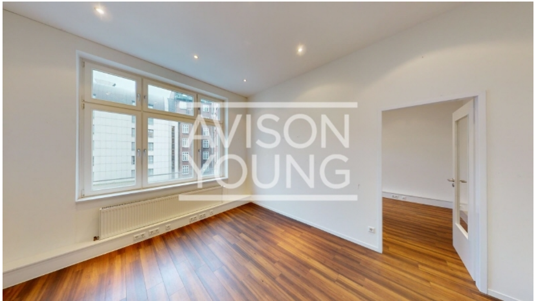
2 Obergeschoss, Innenansicht