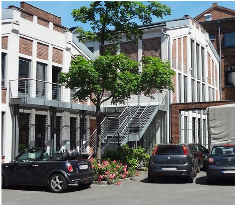
Aussenansicht mit Stellplätzen