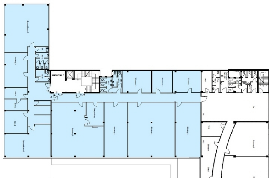
Grundriss 1 OG, ca 920 m 2