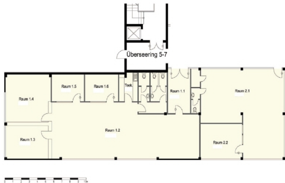
Grundriss Fußgängerebene 400 m 2