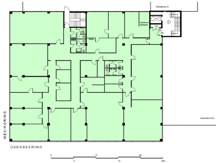
Grundriss 2 OG 950 m 2