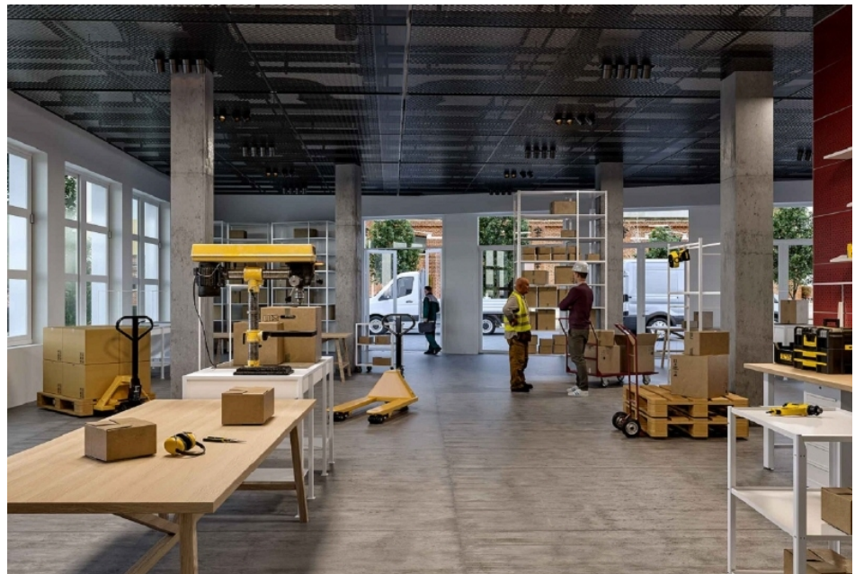
Visualisierung 2 Innenbereich