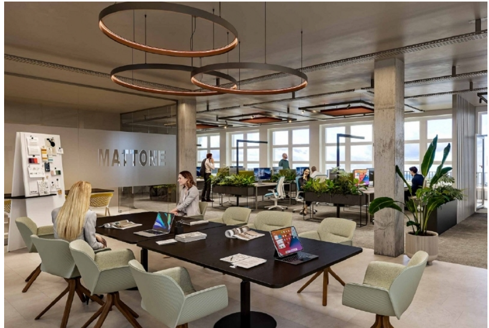
Visualisierung 1 Innenbereich