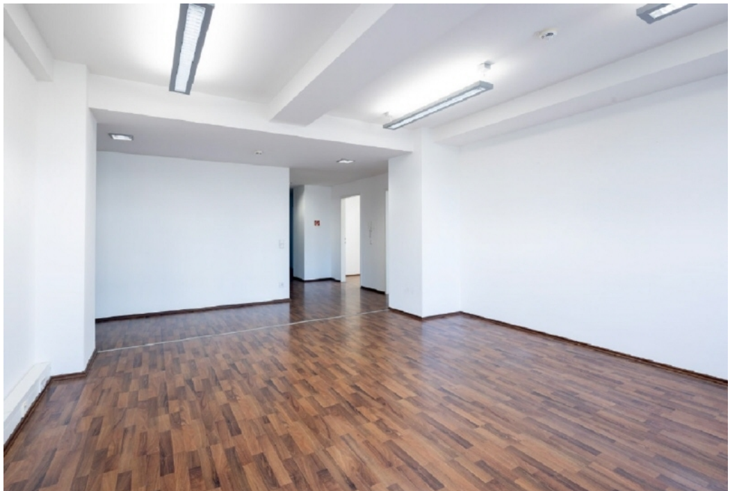
Innenansicht 2 - 3 OG