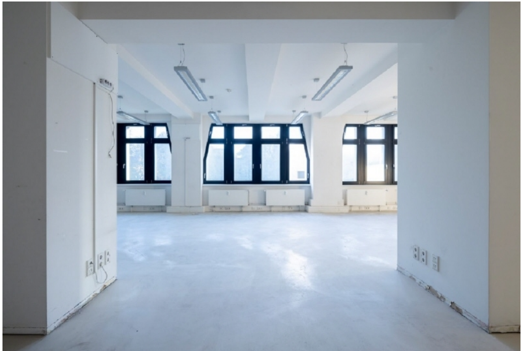
Innenansicht 1 OG