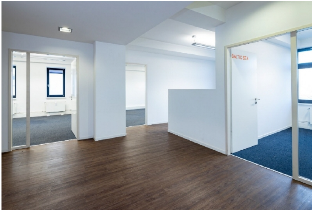
Innenansicht 1 - 3 OG