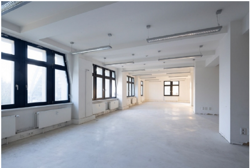
Innenansicht 2 1 OG