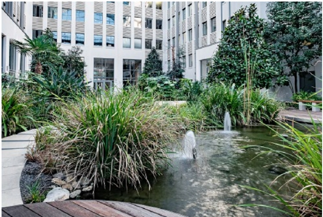
Atrium Ansicht 2