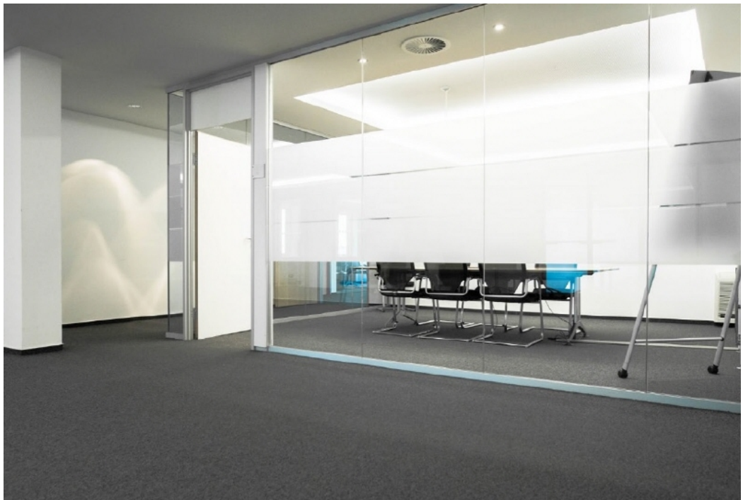
Flur - Besprechung - exemplarisch