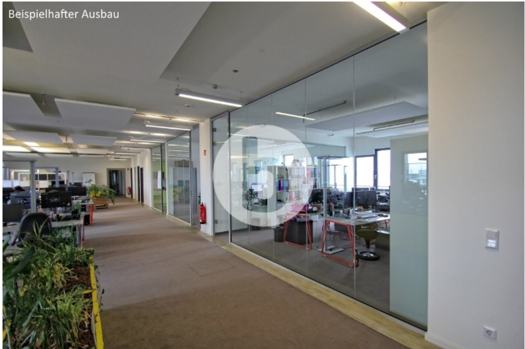
Sumatrakontor Überseeallee 1-3 Hamburg Hafencity Bürogebäude Innenansichten (2)