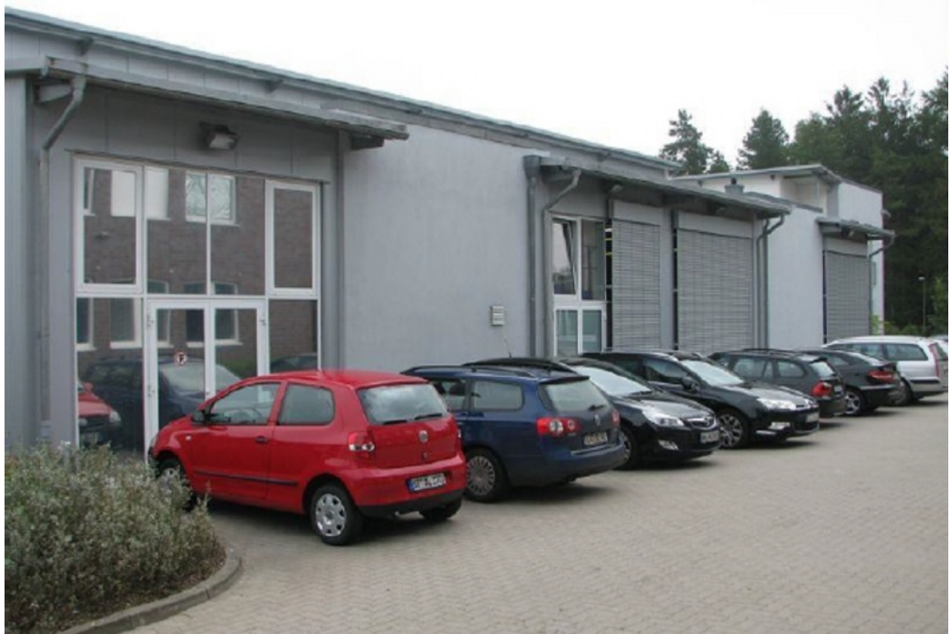
Außenansicht 4 - Parkgelegenheiten