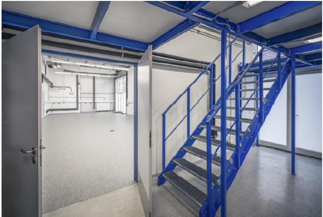
Lager zzgl 2 Ebene