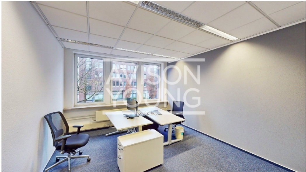
Haus A 1 OG Innenansicht