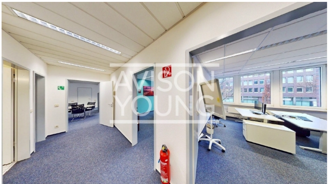
Haus A 1 OG Innenansicht