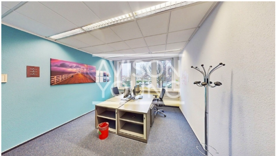
Haus A 1 OG Innenansicht