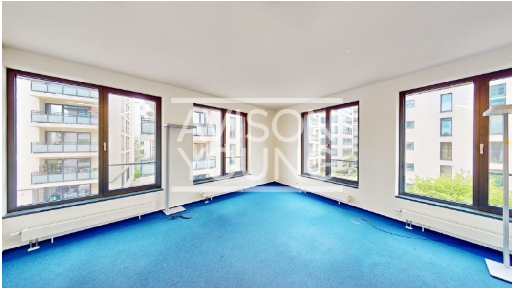
Innenansicht 2 OG