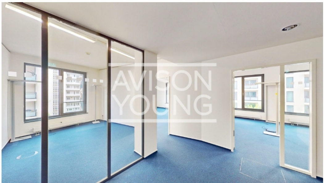
Innenansicht 2 OG