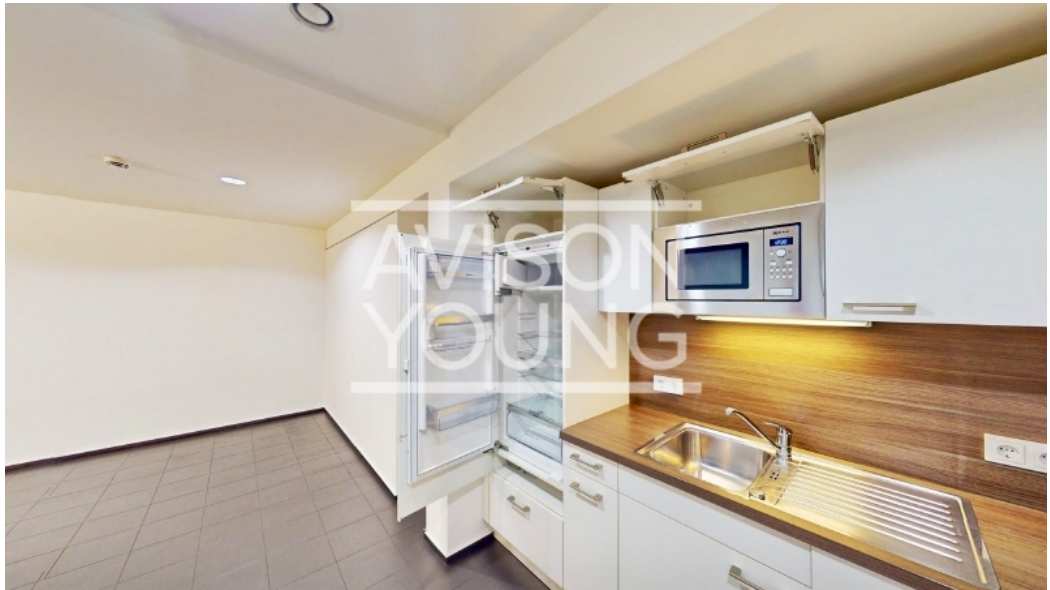
Innenansicht 2 OG