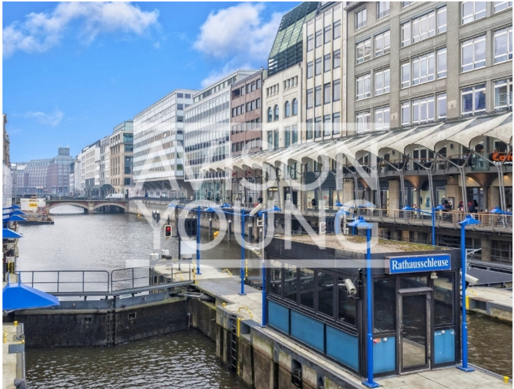
Blick über den Kanal