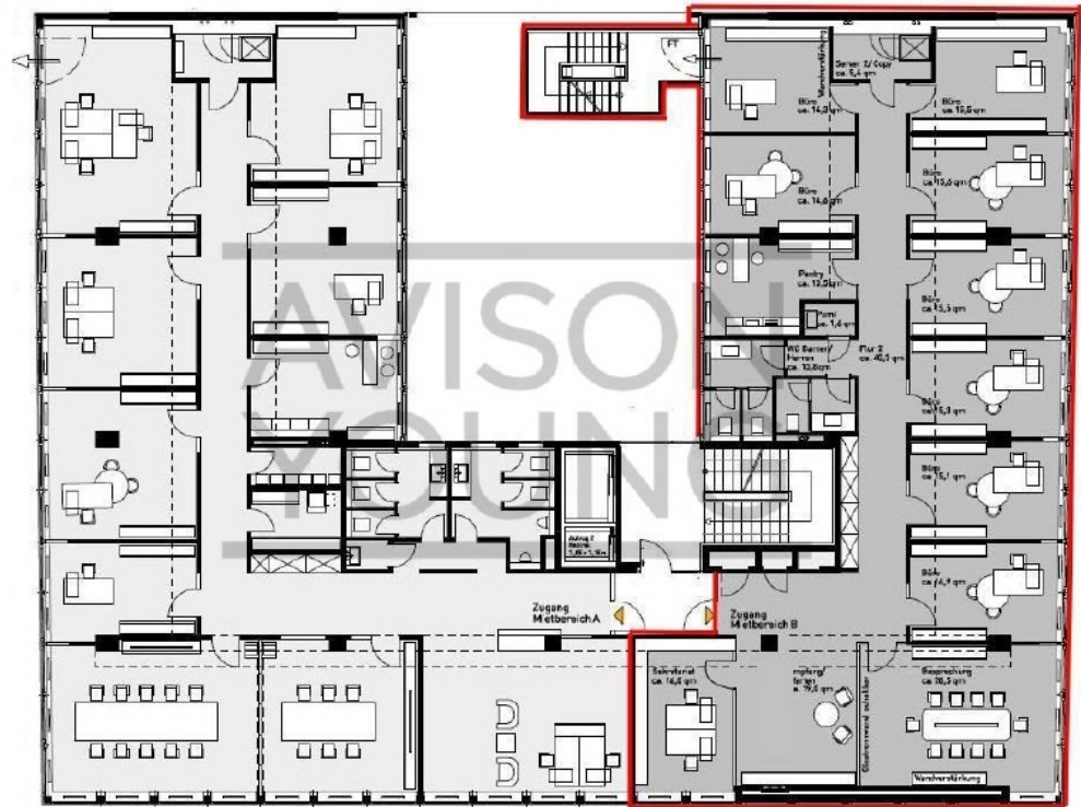
2 OG mit ca 289 m 2