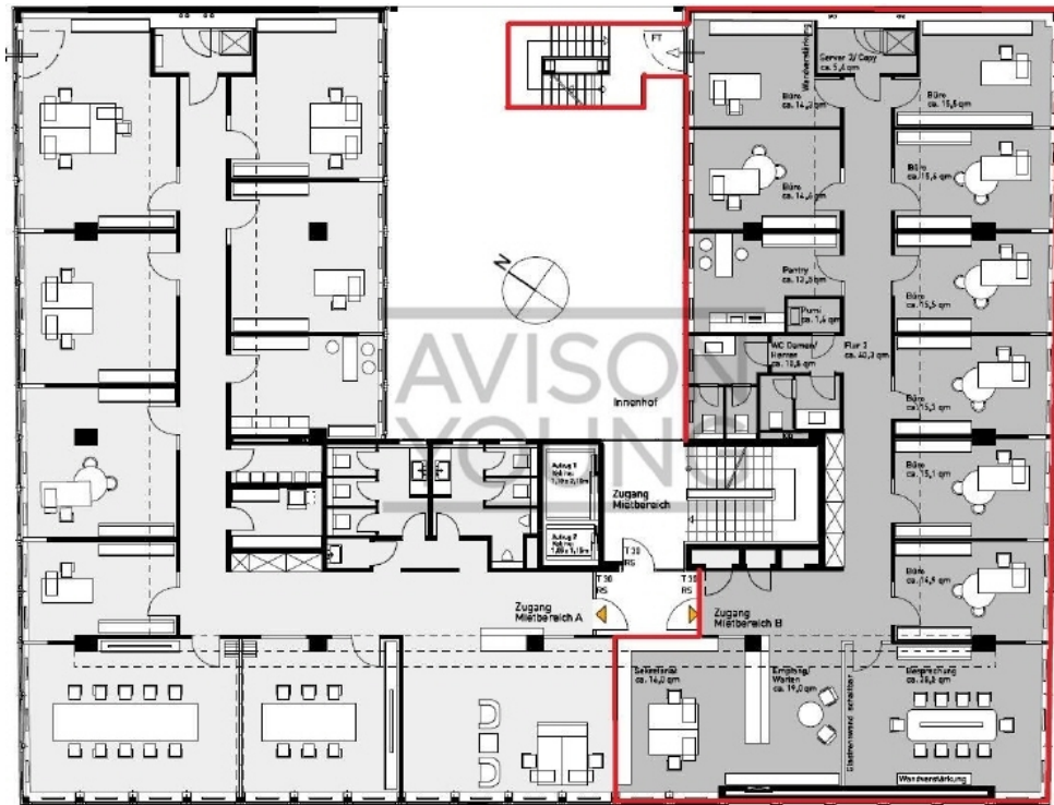
3 OG mit ca 289 m 2