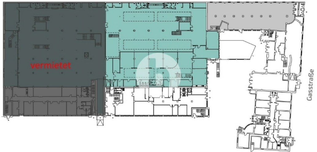
Gasstraße 14-16 - Erdgeschoss mit ca 1500 m 2