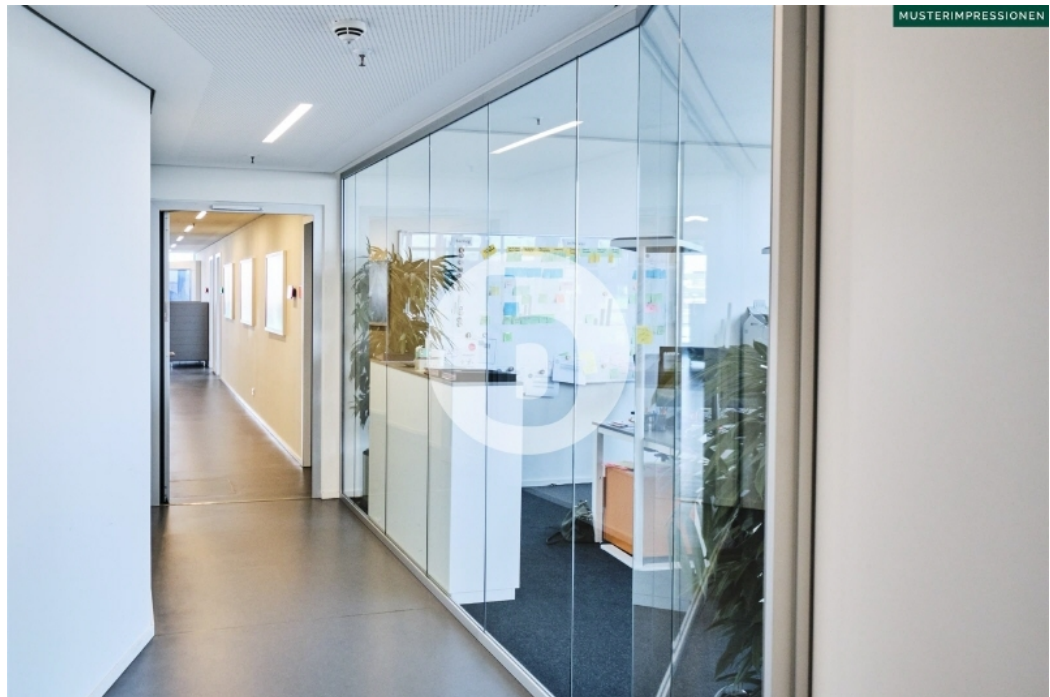
LES 1 Ludwig-Erhard-Straße 1 Hamburg City Büro Innenansichten