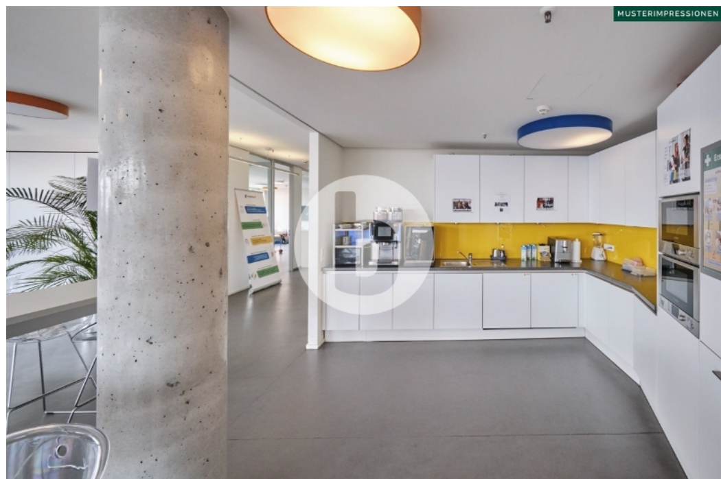
LES 1 Ludwig-Erhard-Straße 1 Hamburg City Büro Innenansichten