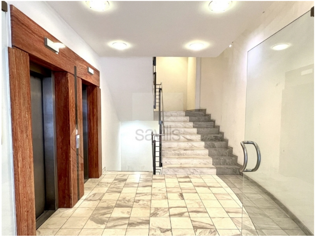
Aufzüge und Treppenhaus