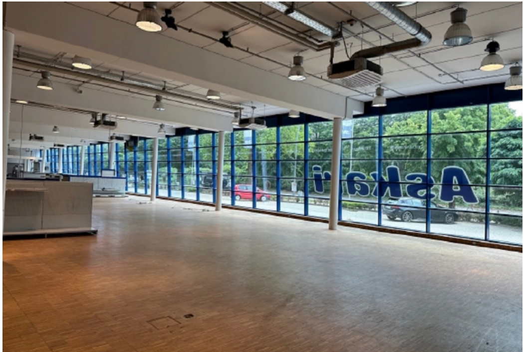
Innenansicht 2 Gewerbfläche