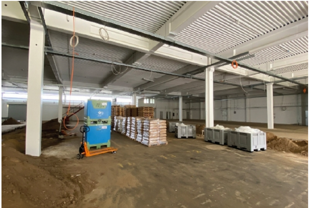
Ansicht 3 Hallenflächen