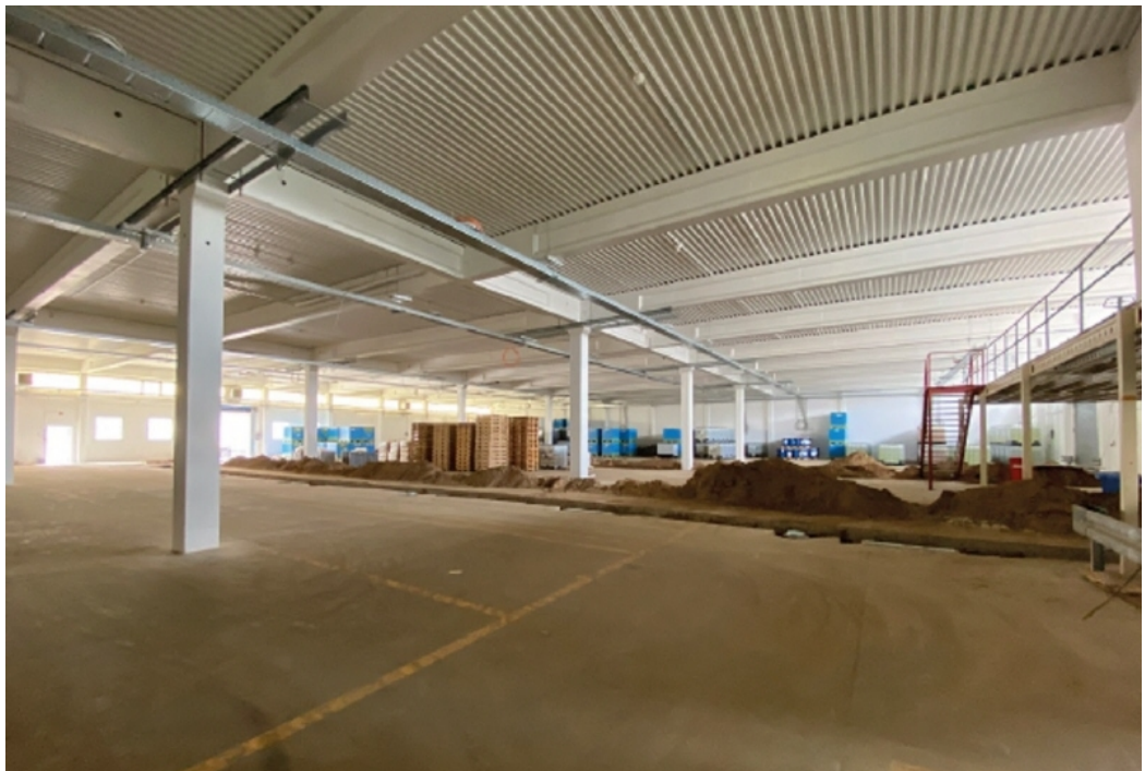
Ansicht 2 Hallenflächen