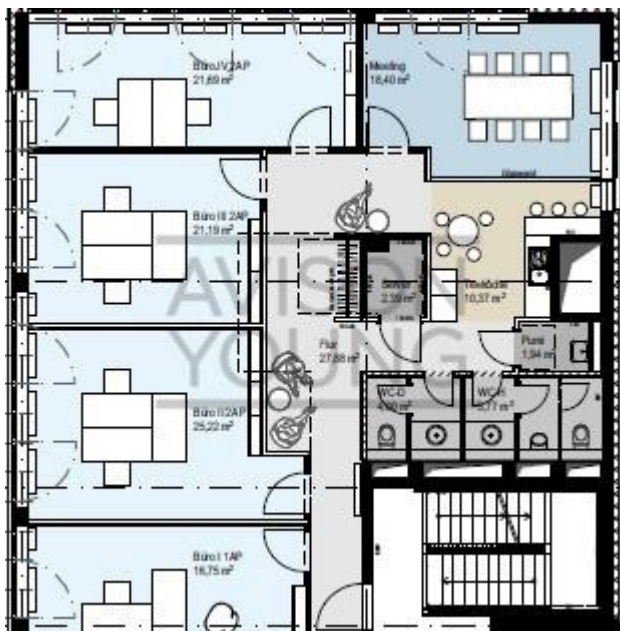
An der Alster 2 OG