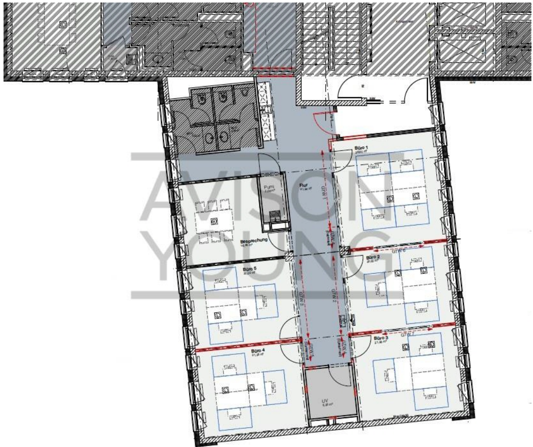
An der Alster 5 OG