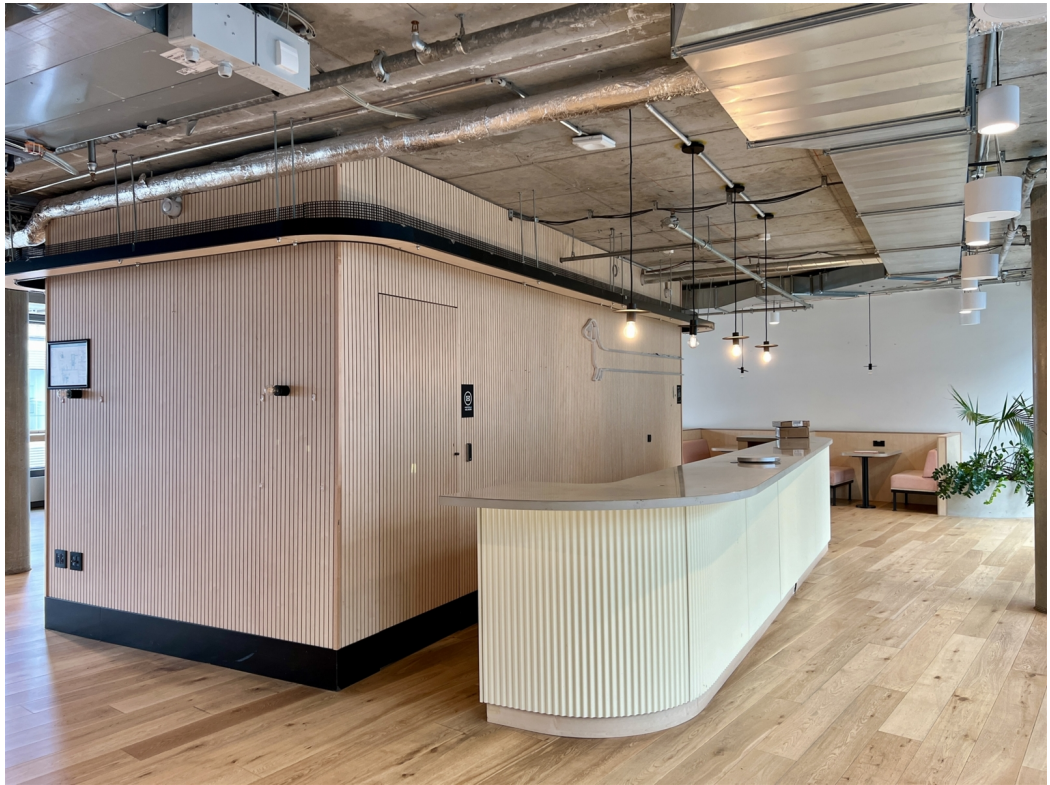
Hermannstraße 13 Eingang