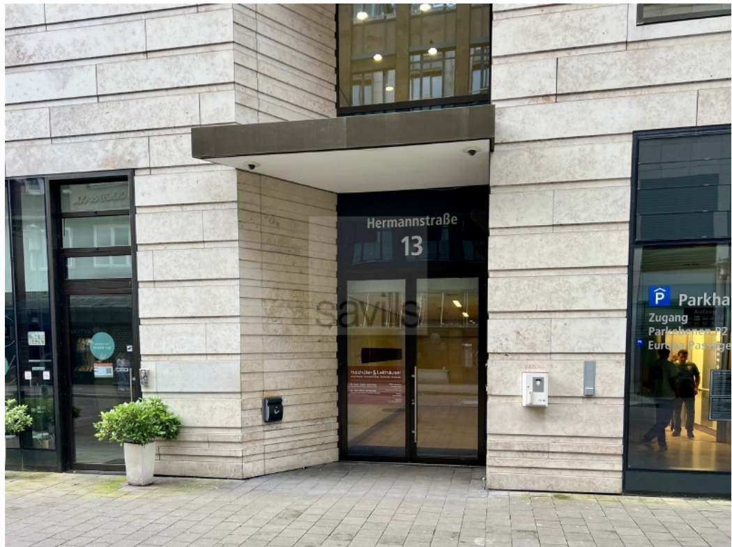
Euopa Passage Hermannstraße 13 Außenansicht SAVILLS