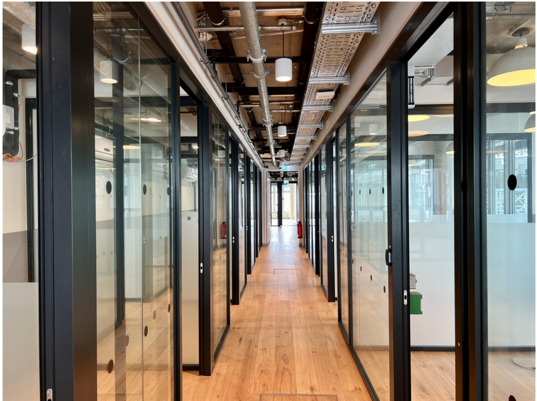
Hermannstraße 13 Flur zu den Einzelbüros