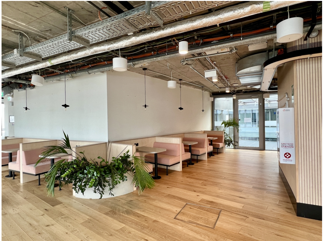
Hermannstraße 13 Innenansicht 2