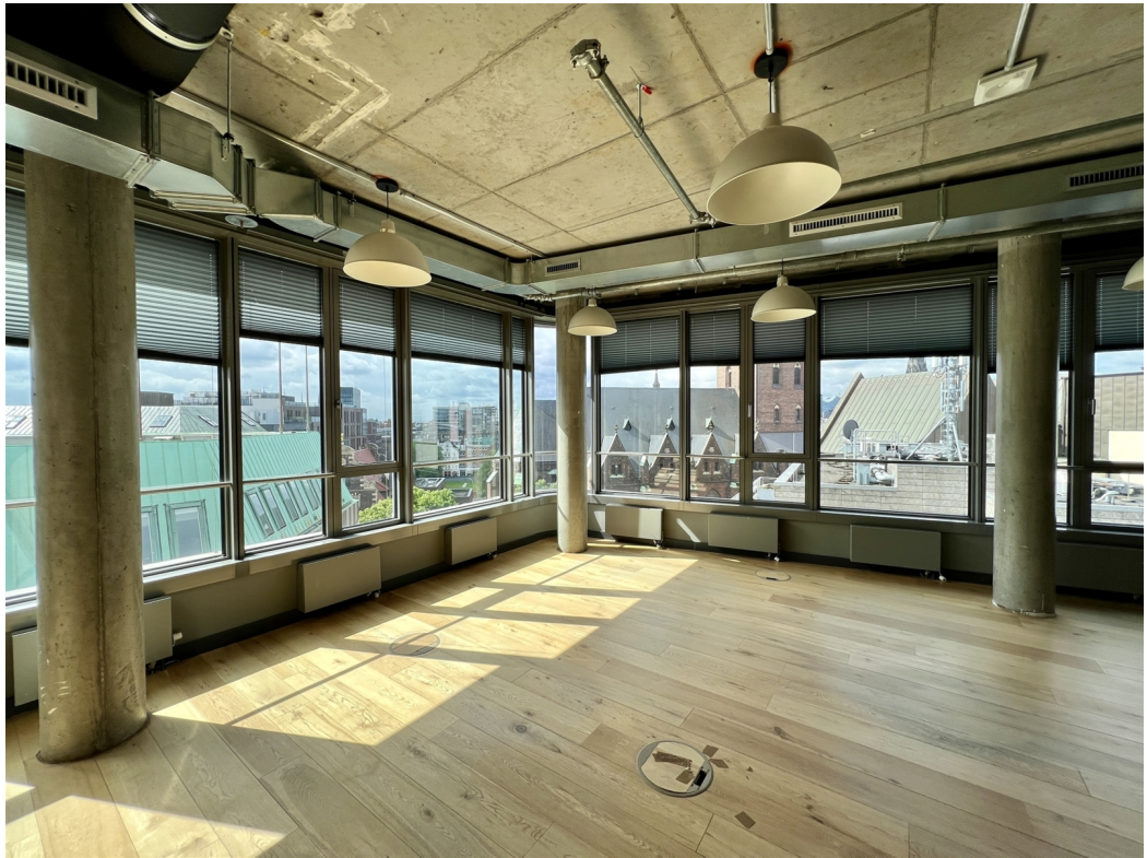
Hermannstraße 13 Innenansicht 2 (2)