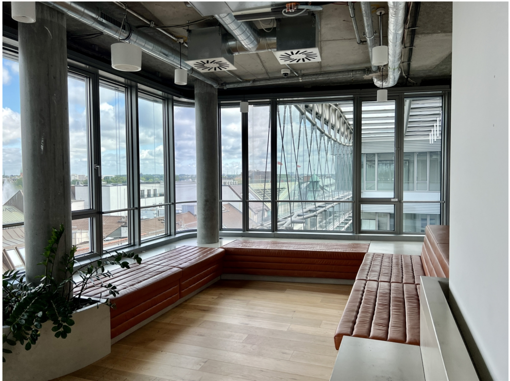
Hermannstraße 13 Lounge