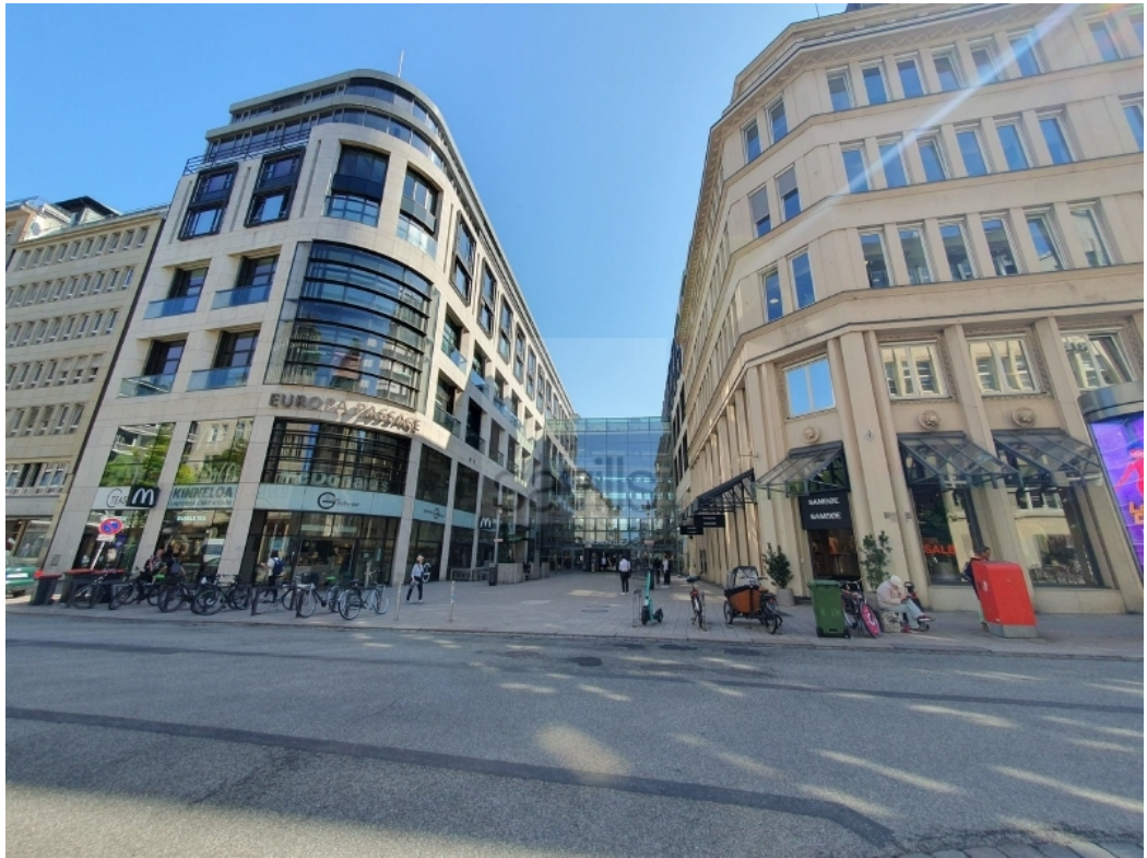
Europa Passage-Hermannstraße 13 Außenansicht 2 SAVILLS