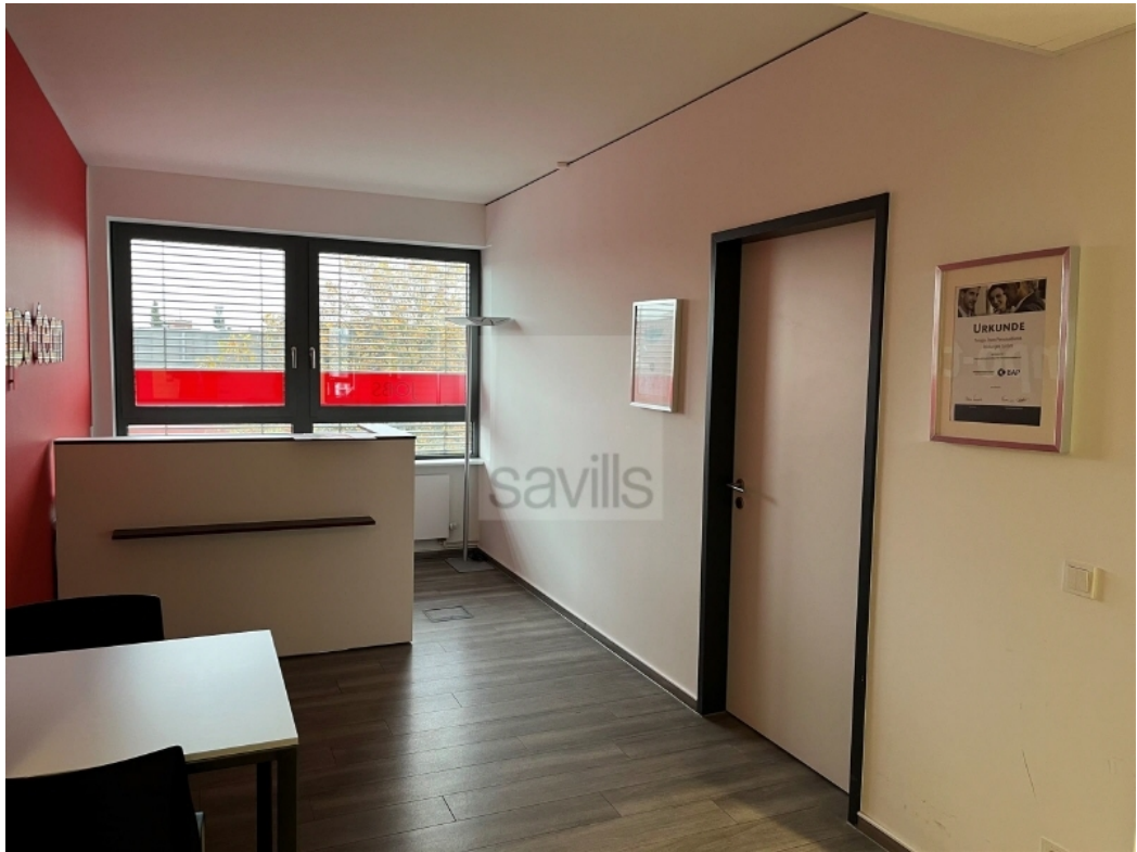
4 OG Empfang