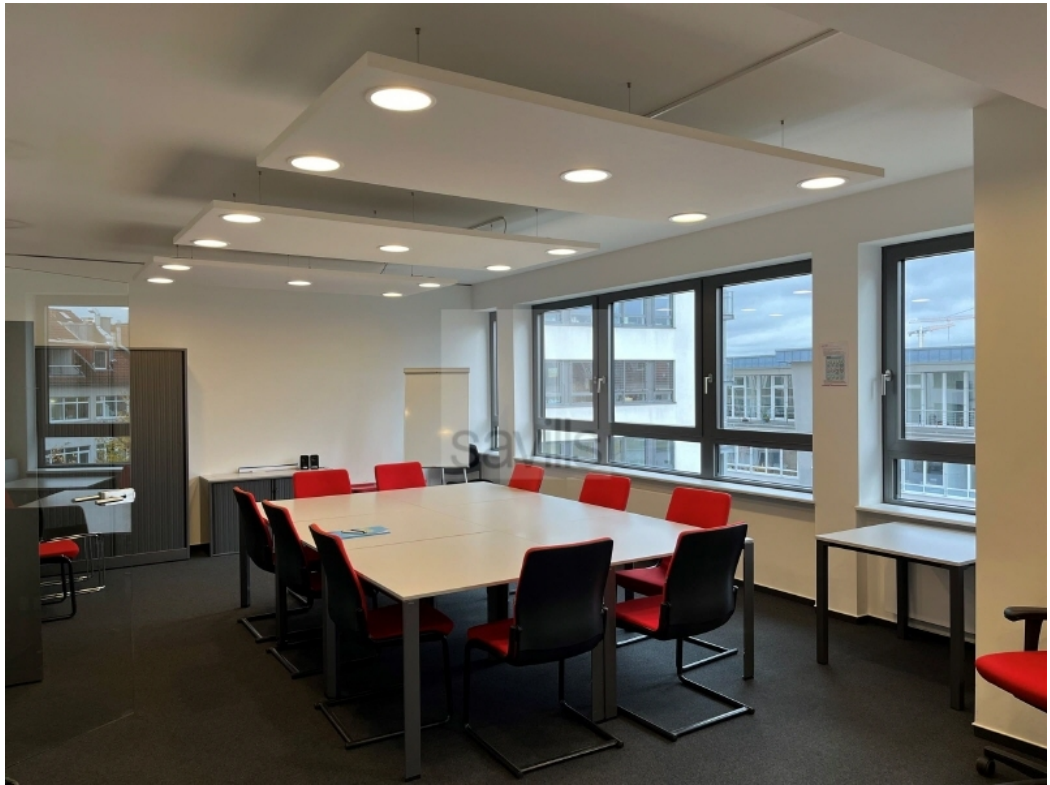
4 OG Besprechung