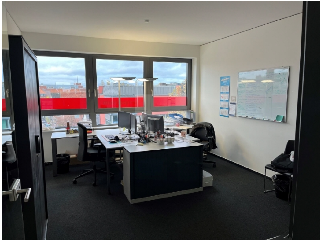
4 OG Büro