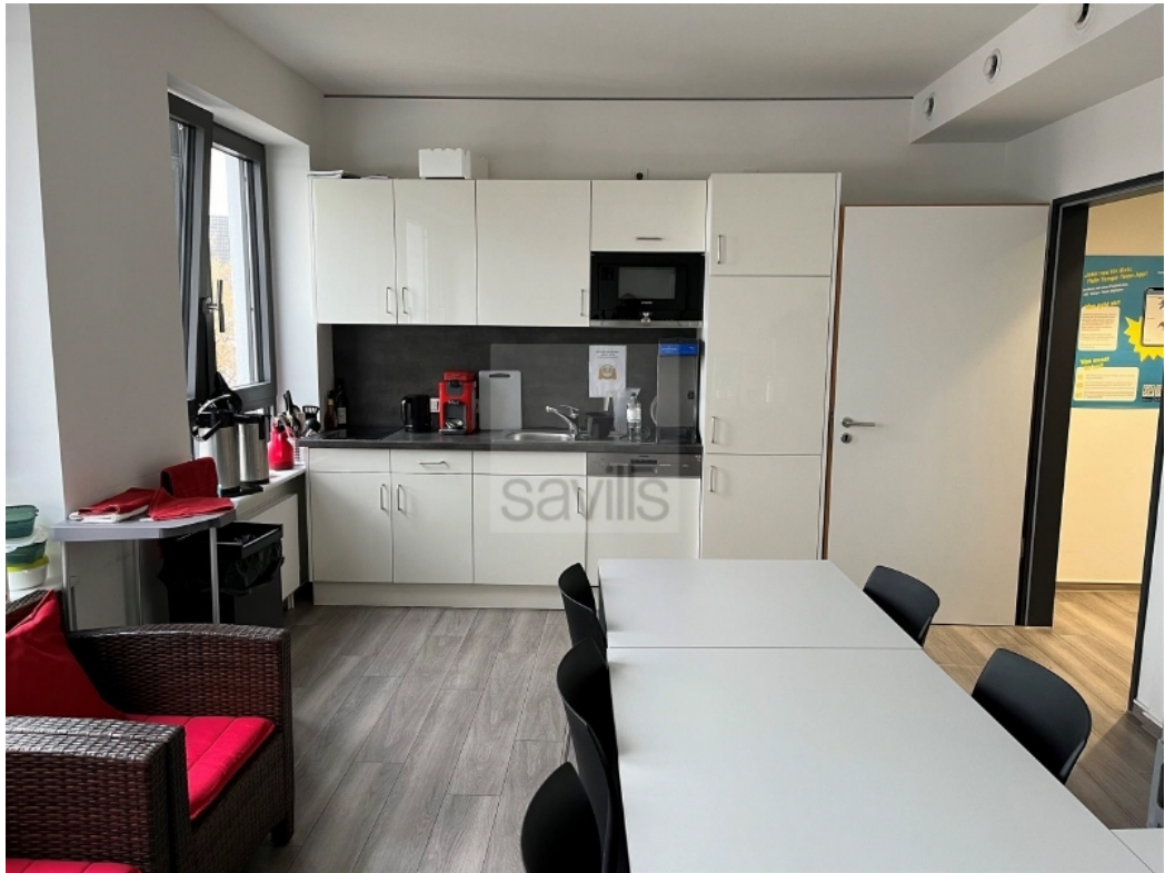
4 OG Besprechung 1 - Teeküche