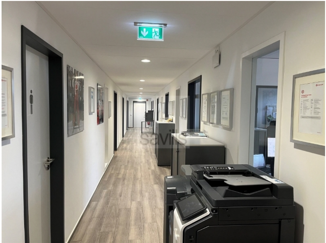
4 OG Flur