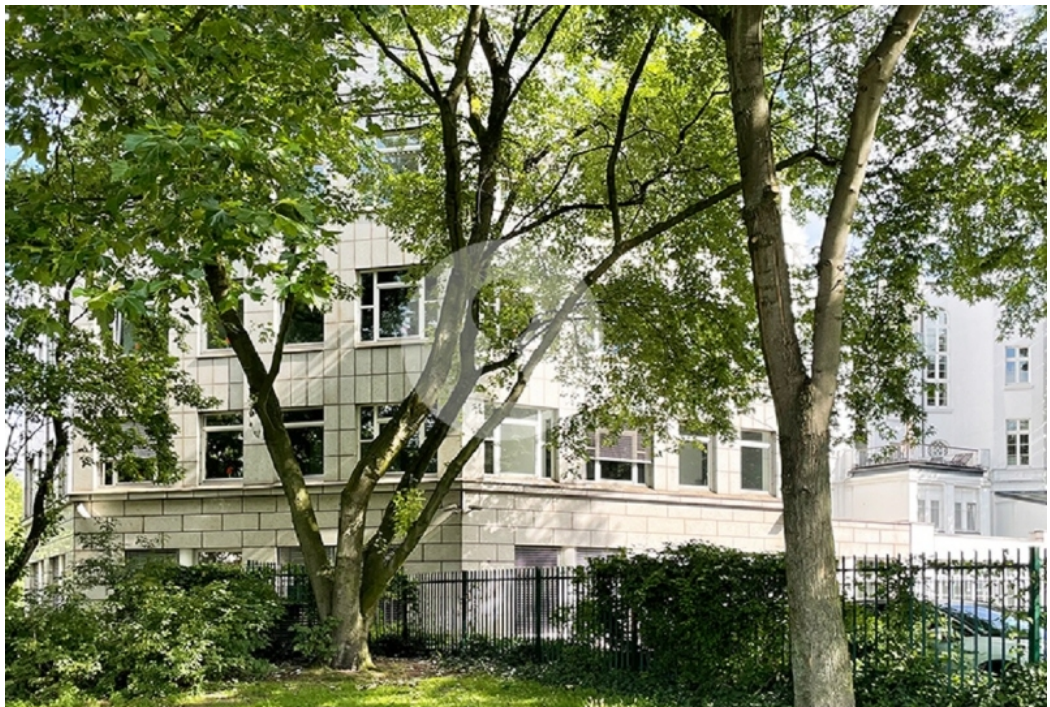
Top Büros in Alsterlage