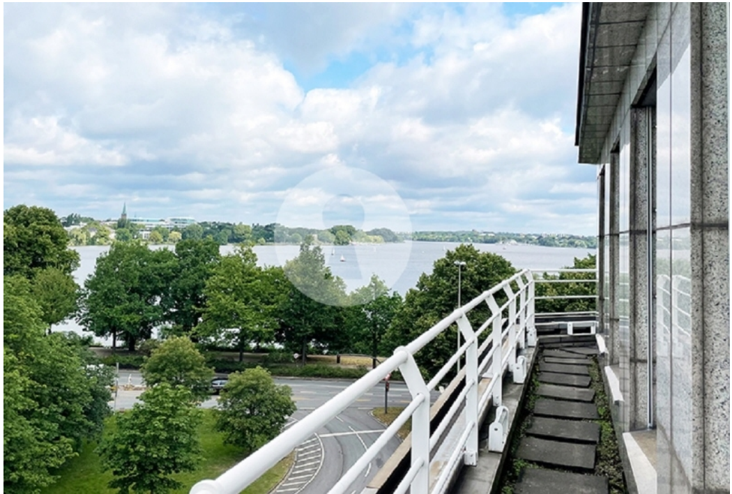
mit umlaufende Austritten