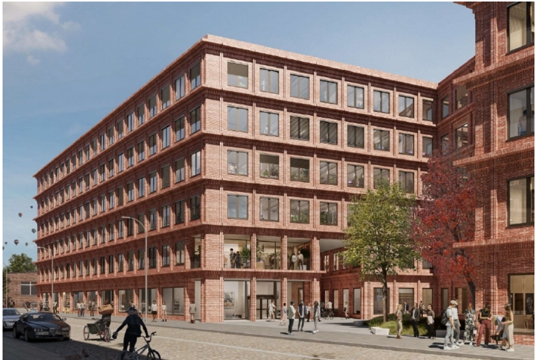
South Central (Visualisierung 2)