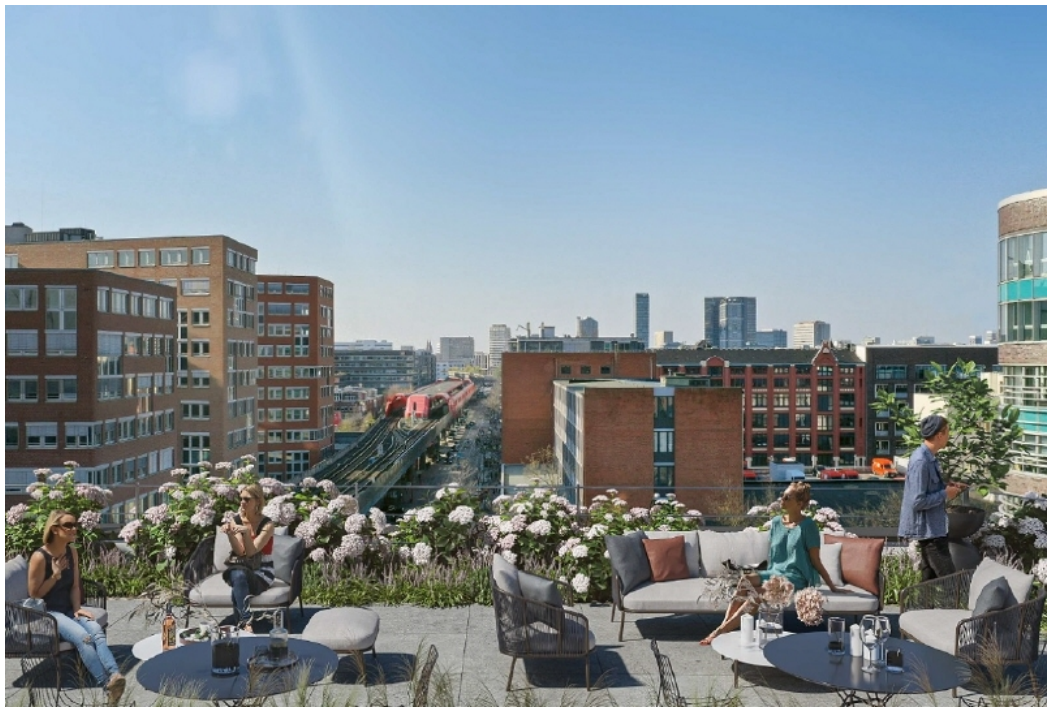
Ansicht 2 Dachterrasse 5 OG (Visualisierung)