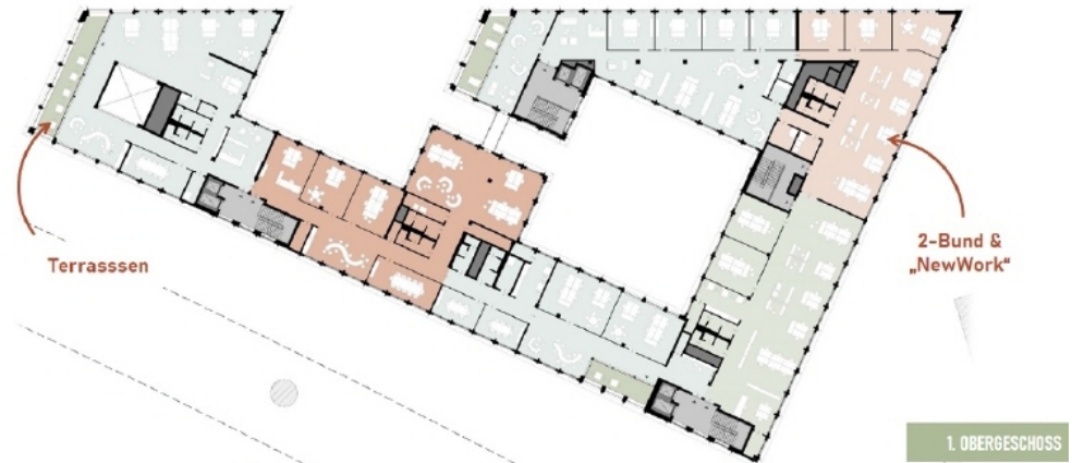
Grundriss 1 OG