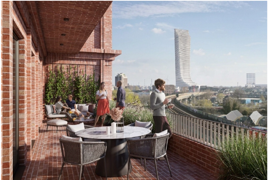
Ansicht 1 Dachterrasse 5 OG (Visualisierung)