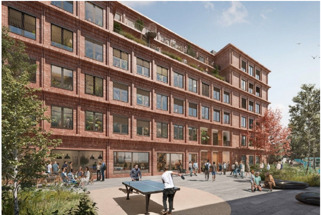
Freiflächen mit hoher Aufenthaltsqualität (Visualisierung)