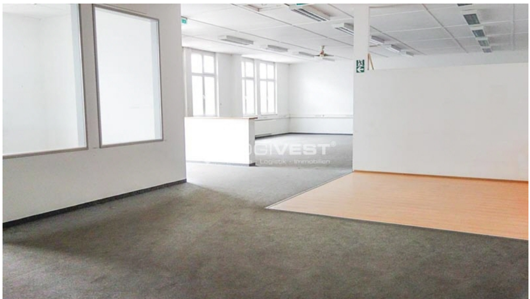
Musterbild Service- und Büroflächen