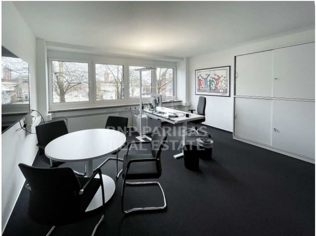
Innenansicht - Einzelbüro