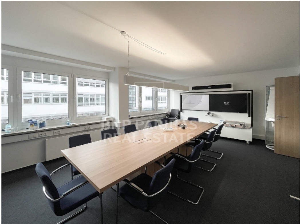
Innenansicht - Meetingraum