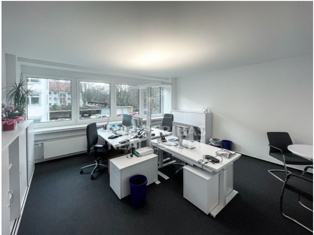
Innenansicht - Doppelbüro