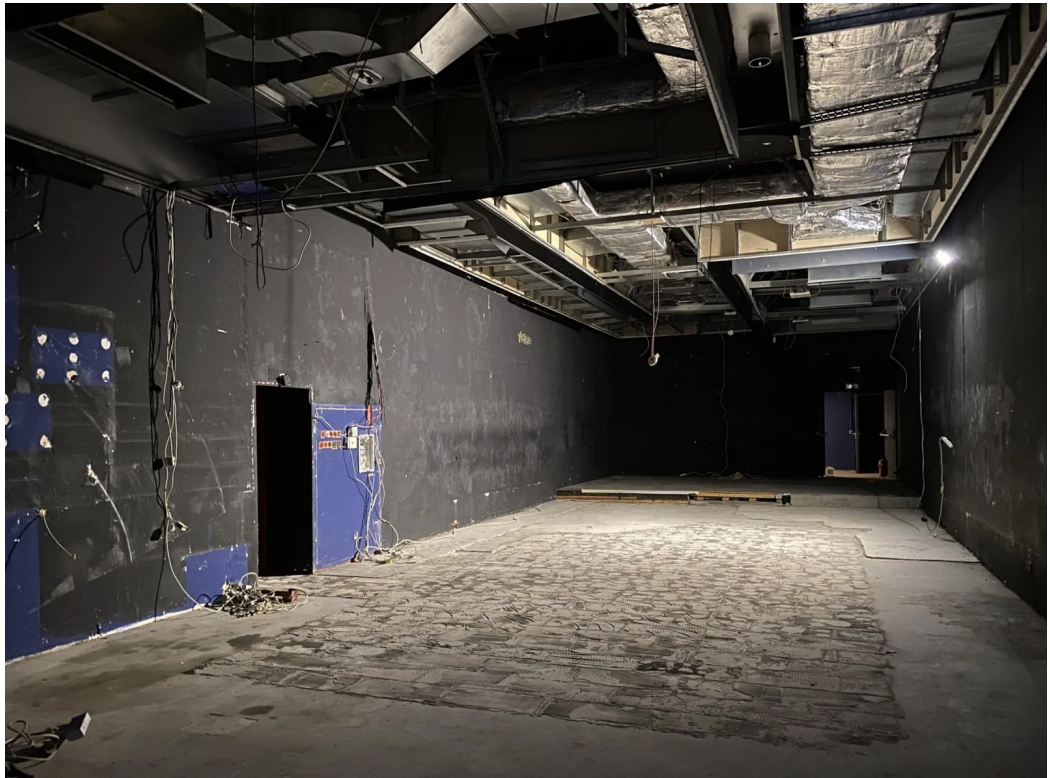
UG | Innenansicht