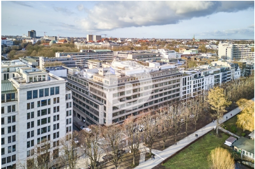
Alsterufer 4-5 Hamburg Rotherbaum Bürogebäude Außenansicht