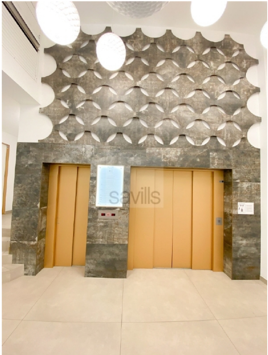
Mönckebergstraße 11-13, Fahrstuhl