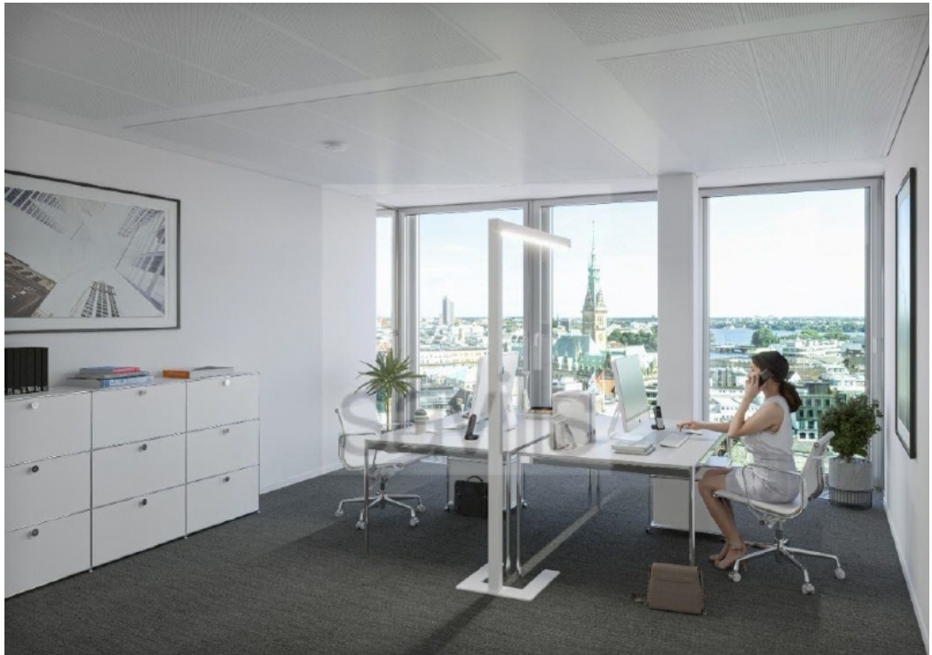
TRIIIIO - Visualisierung