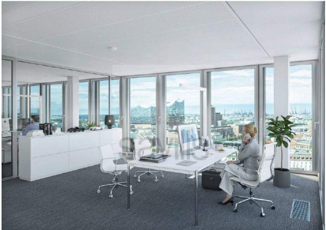
TRIIIIO - Visualisierung