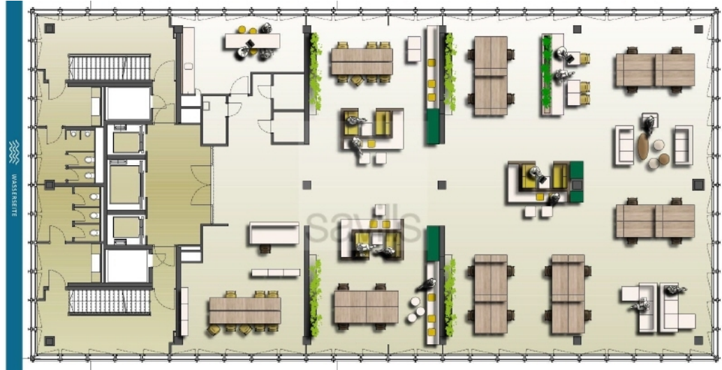
TRIII O - Regelgeschoss - Mustergrundriss