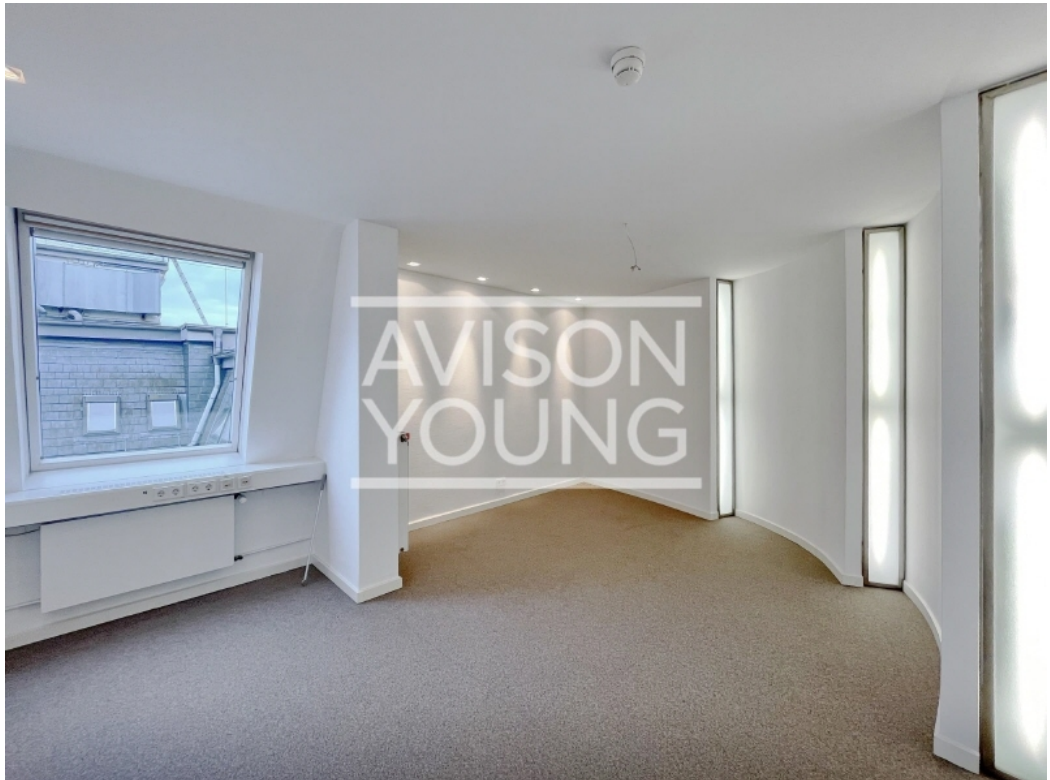
Innenansicht 6 Obergeschoss