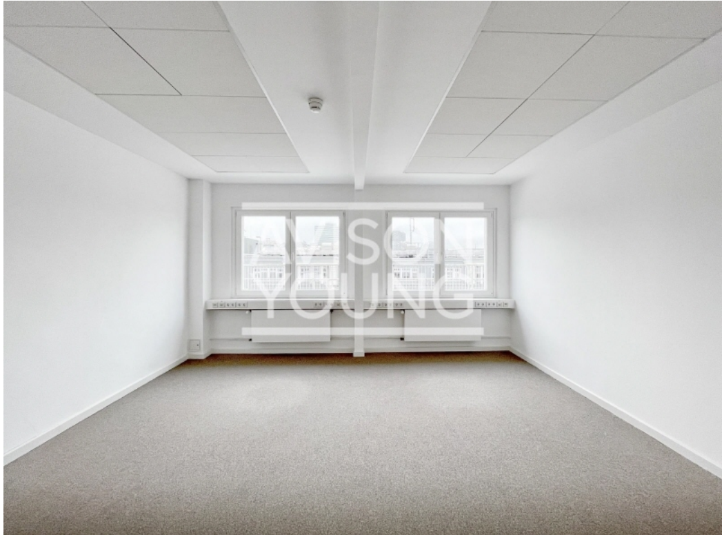
Innenansicht 6 Obergeschoss