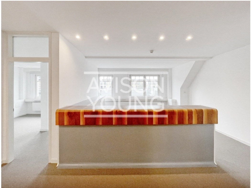
Innenansicht 6 Obergeschoss