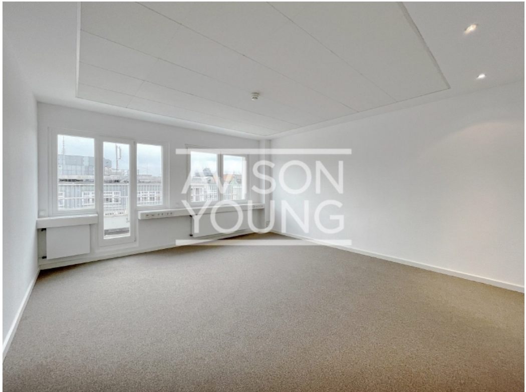
Innenansicht 6 Obergeschoss