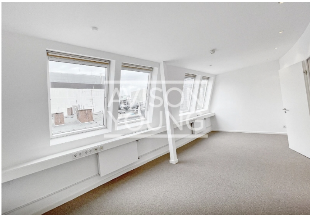
Innenansicht 6 Obergeschoss