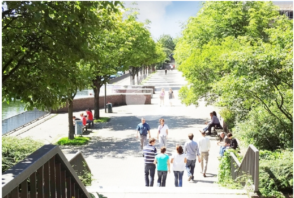
Attraktive Umgebung für die Mittagspause