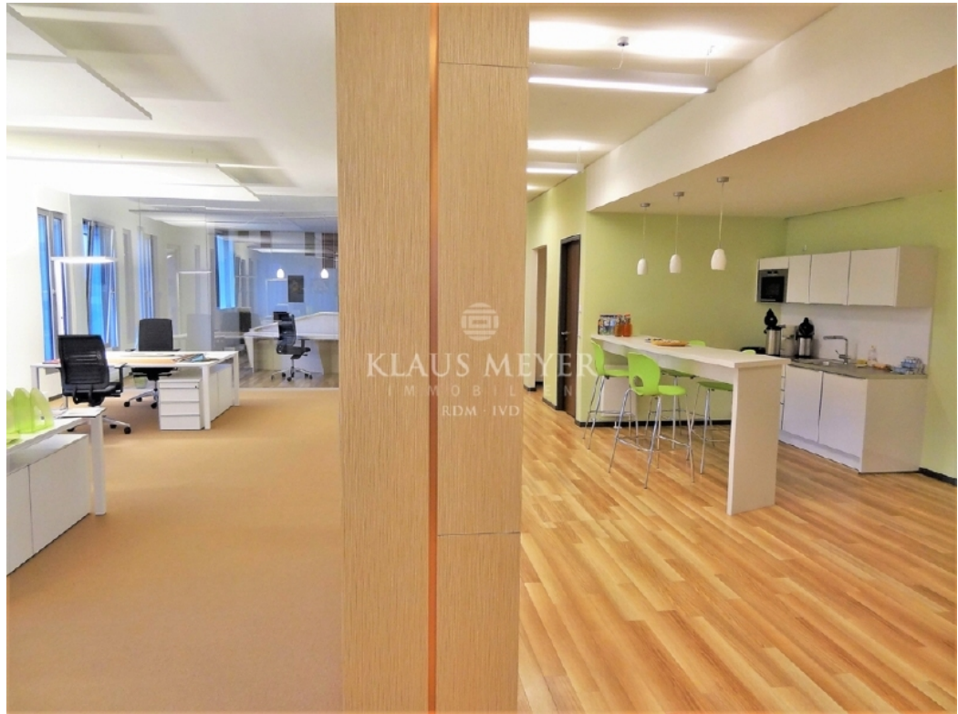
Beispiel Ausstattung Musterbüro (8)