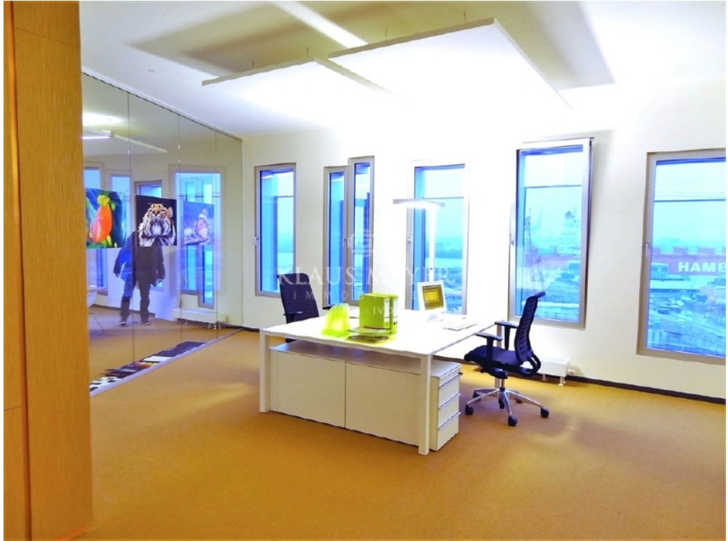
Beispiel Ausstattung Musterbüro (2)