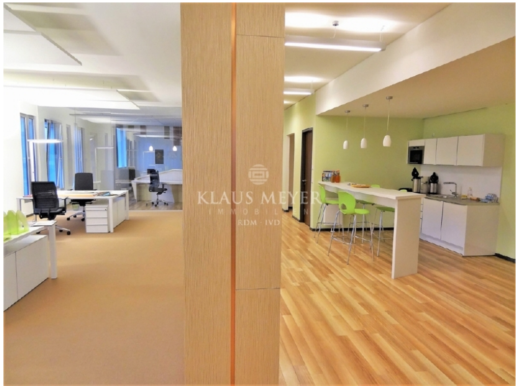
Beispiel Ausstattung Musterbüro (8)