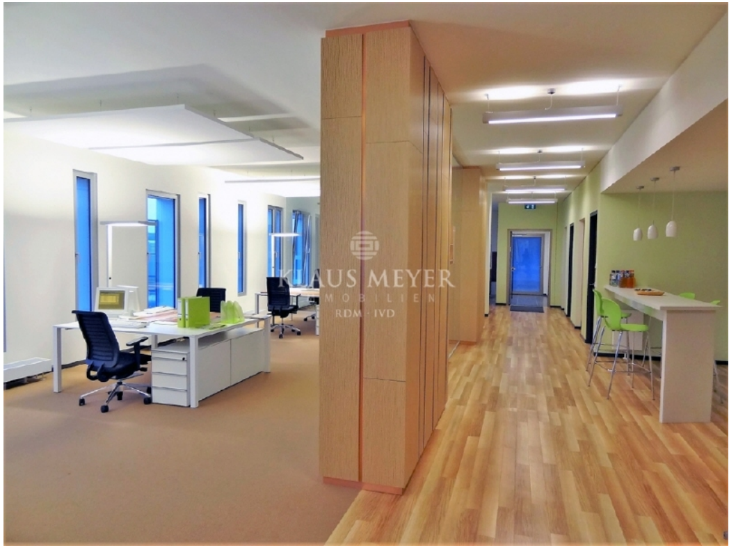
Beispiel Ausstattung Musterbüro (5)