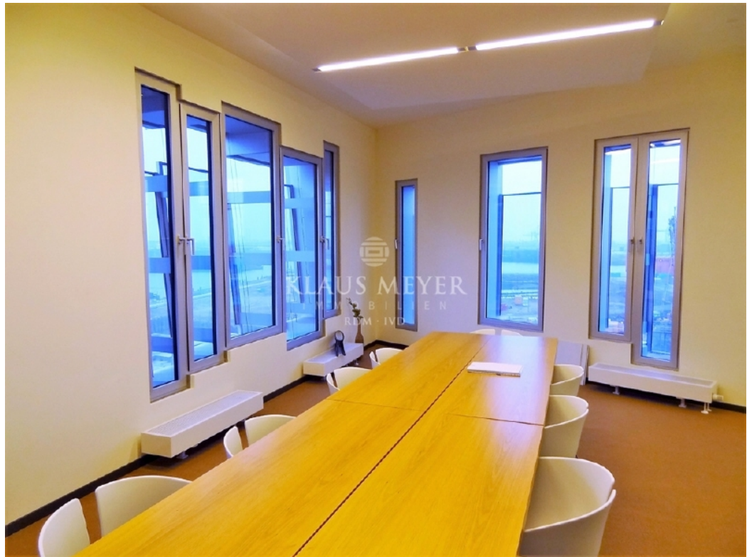
Beispiel Ausstattung Musterbüro (7)