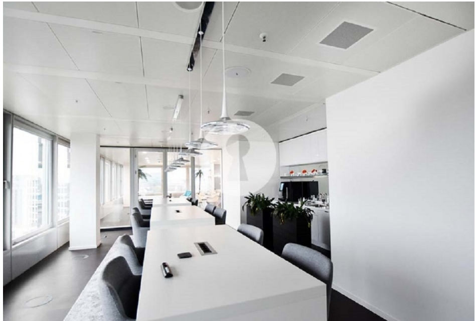
Ausgebaut mit hochwertiger Küche