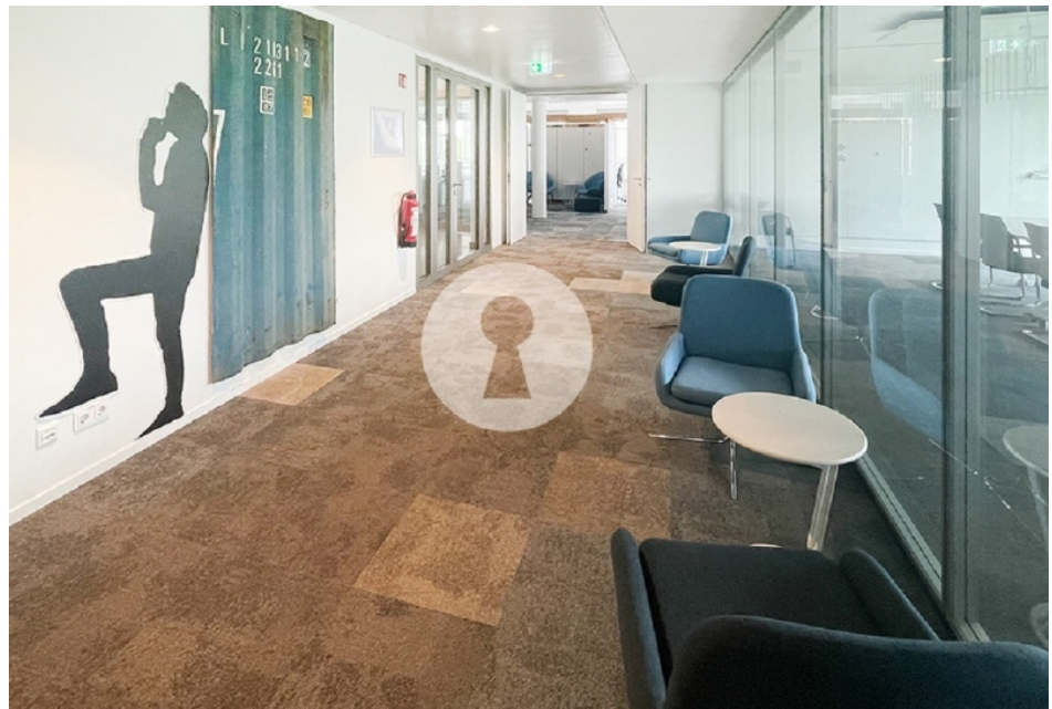
Hochwertiger Ausbau und gekühlte Büros