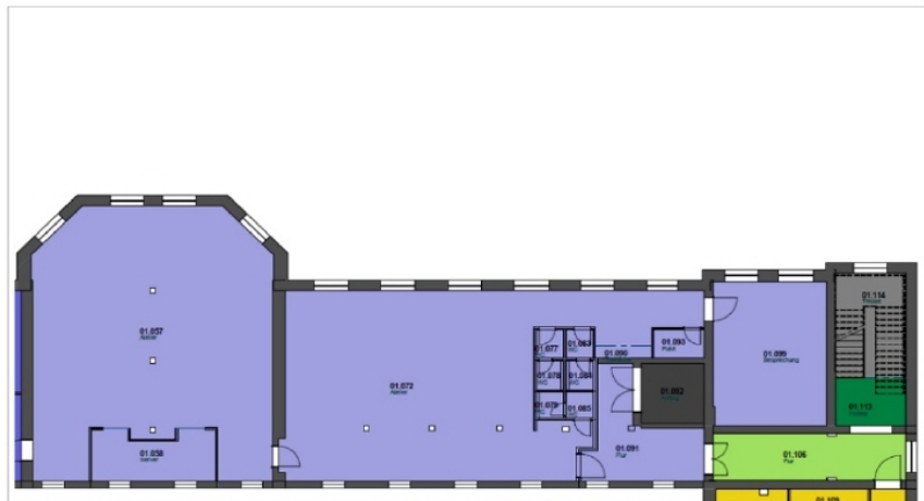
Grundriss 1 OG