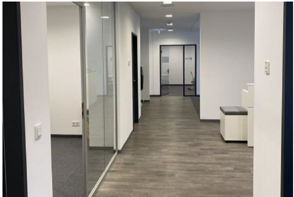
Innenansicht 1 Haus 4, 1 OG