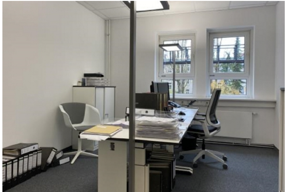
Innenansicht 2 Haus 4, 1 OG