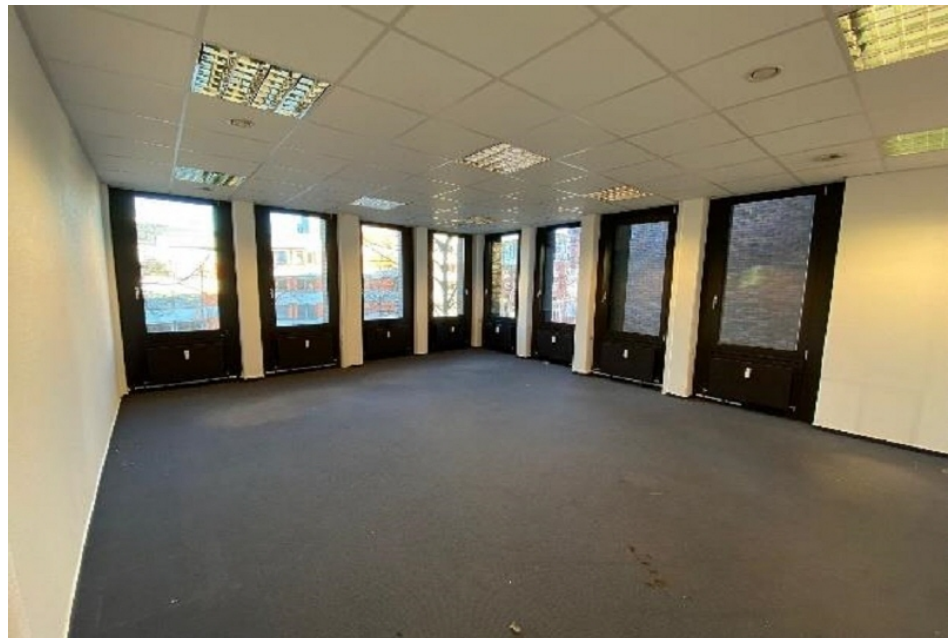
Innenansicht 2 Büroflächen