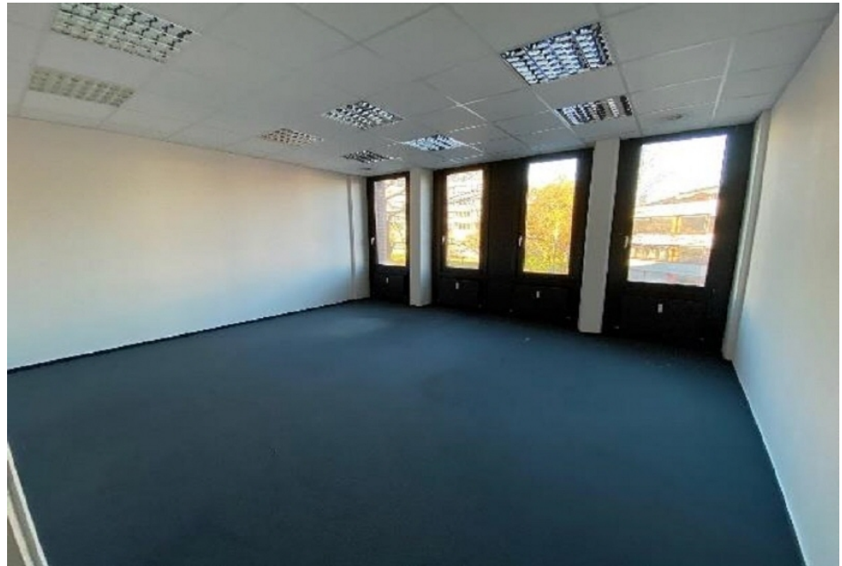
Innenansicht 1 Büroflächen