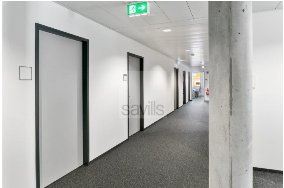
Flur Hartzloh 25, Fuhsbüttler Straße - Quartier21