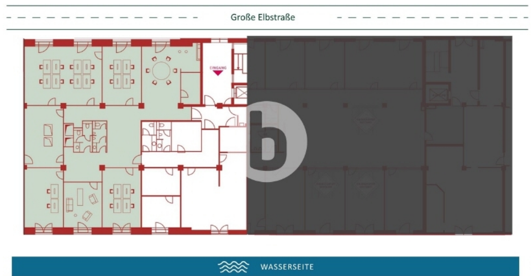
1 Obergeschoss mit ca 371 m 2