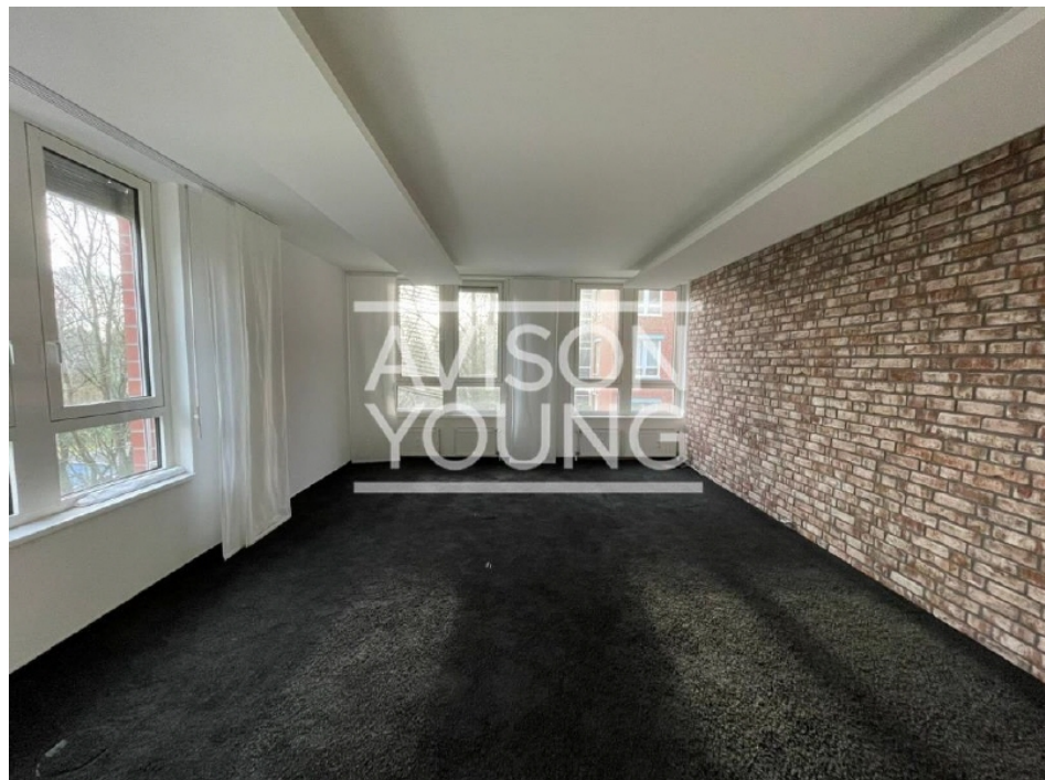
Innenansicht 1 Obergeschoss