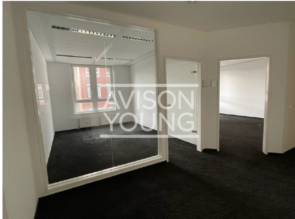
Innenansicht 1 Obergeschoss