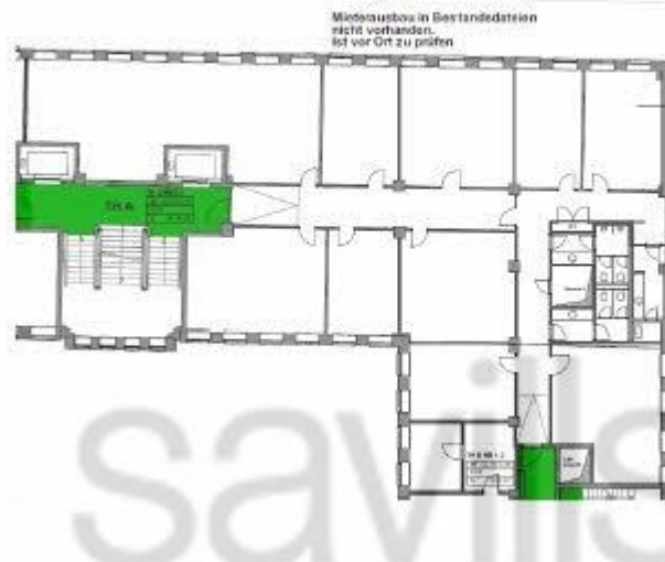
Altstädter Straße 6_4 OG 520,77 m 2